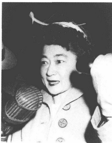
※ 二战期间，日军利用广播瓦解美军士气的播音员“东京玫瑰”户粟郁子

的具有民族特色的模式。也必须得了解日本人这些行动和意志背后具有什么样的制约力。这个研究要求我们不能再以美国为中心，不能再用美国人习惯的方式揣测日本人的行事。说什么在某某情况下，我们会如何做，日本人一定也会如何。我们必须把美国人做事的那些前提暂时扔到一边，然后尽可能不做出轻率的结论。