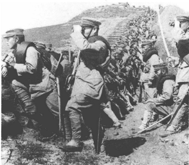
※ 日俄战争中严阵以待的日军士兵

成性，又非常怯懦”；“他们的行为既是出于注重自己的面子，同时又是出于真诚的良心”；“他们在军队中接受像机器人一样的训练，但又会出现不服从管教，甚至进行兵谏的情况”；“他们对于西方文化热诚倾慕，但又顽固地认为自己民族的文化并不比西方差”。