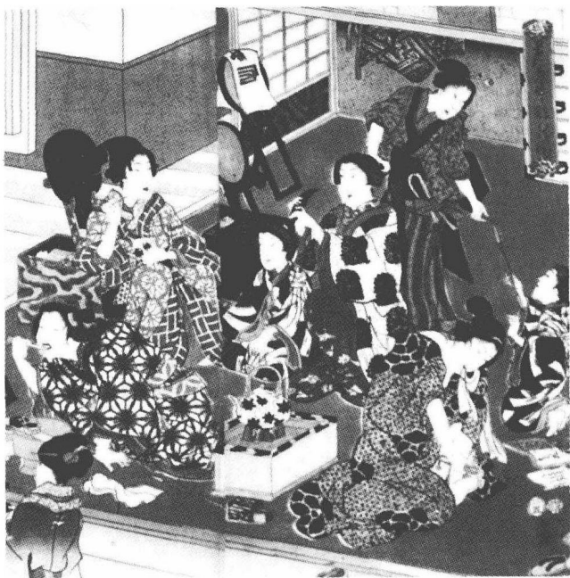
※ 日本家庭中的女人和孩子

化之间的相似性的价值意义所在，我只是希望通过这些与日本文化有相似之处的文化，来揣测和理解日本人的生活方式。另外，我也了解一些亚洲大陆国家如暹罗 ① 、缅甸和中国，这可以用来和日本进行比较，因为它们都是亚洲伟大文化遗产的一部分。人类学的发展历史已经证明，进行文化比较是十分有价值的。很可能一个部