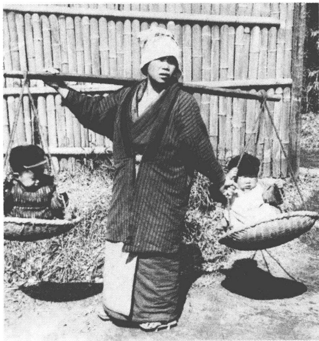
※ 用担子挑着两个孩子的日本女人

些原始部落中，掌握权力的人往往是被部落成员认为有着灵异色彩的祭司。不过，随着后来的发展，一些经济、政治方面的权力以一种更加清晰的形式反映在日常生活中，教会也就不再继续使用神秘的方式维系自己的权力，它们退出了权力世界。当然一些拥有文字的文明，会有古老世界的记录，只是流传下来的文字，其原有的意义已经改变。宗教