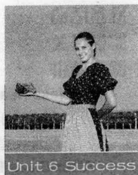
Unit 6 Success