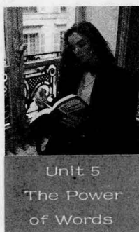
Unit 5 The Power of Words