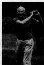
Unit 8 Healthy Living