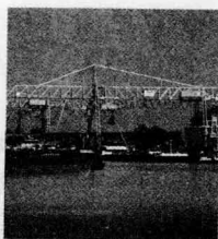
Unit 4 Science and Technology