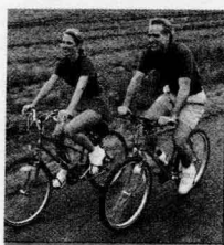
Unit 3 Leisure Activities