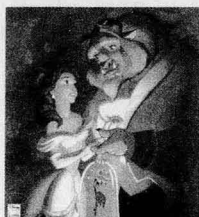
Unit 1 Myths and Legends