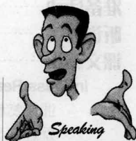
Unit 12 Public Speaking