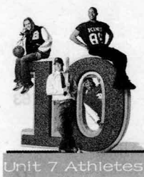
Unit 7 Athletes