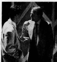
Unit 2 Manners