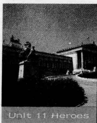
Unit 11 Heroes