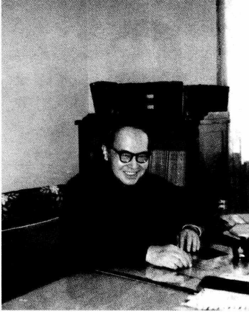
作者在北京三里河南沙溝家中(八十年代)