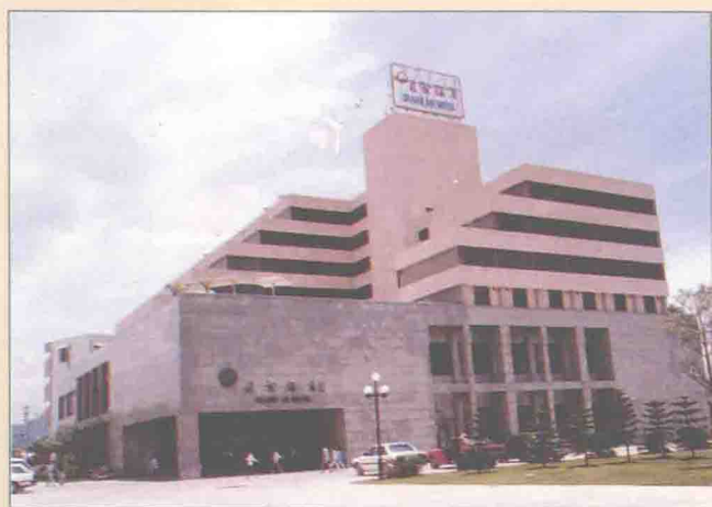
▶ 最近被國家旅遊局評為三星級賓館的長安酒店。