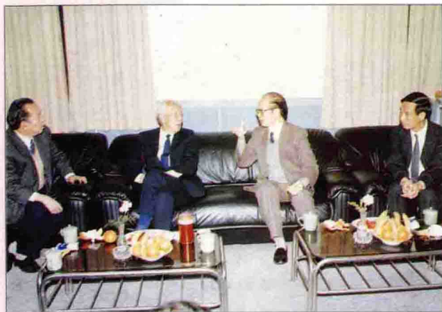
◀ 全國人大常委會委員長萬里（左二），廣東省委書記謝非（右二），東莞市委書記歐陽德（左一），在聽取鎮委書記李毓全匯報工作。