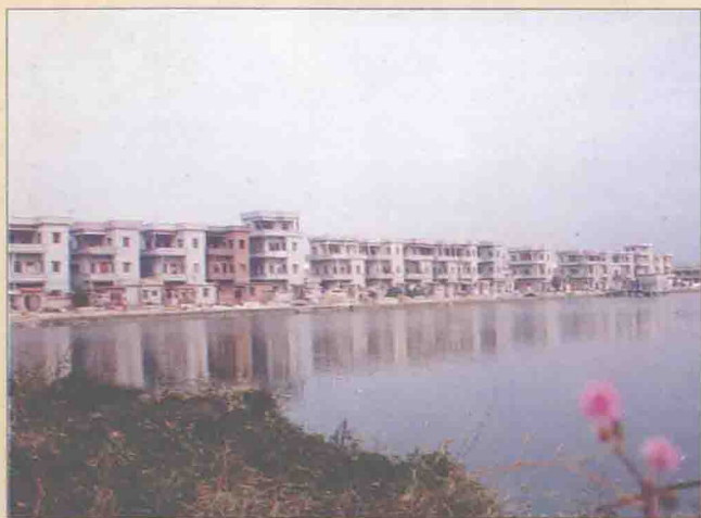
◀ 普通的新式農民住宅樓羣。