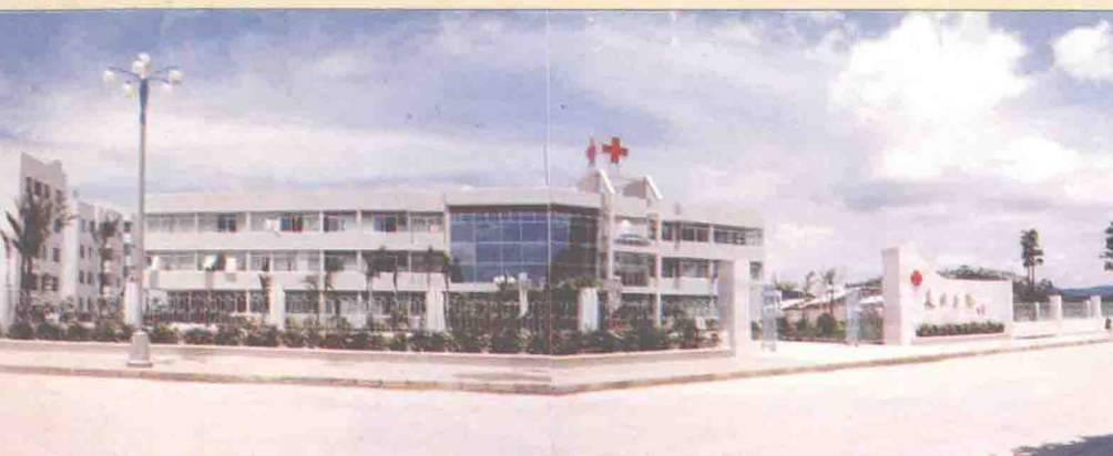
▲ 設施齊備，環境幽雅的新長安醫院。