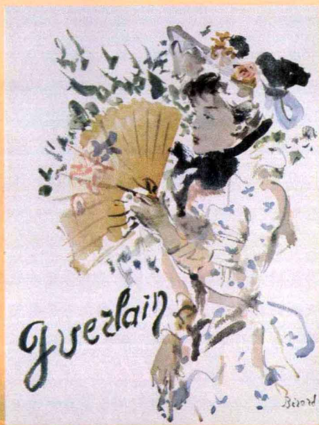
克里斯汀·伯纳 (Christian Bérard) 1945 年插画作品

合的邂逅。在我看来，香水与个人感情世界有着紧密的联系。倾心于某款香水，很可能是因为它用大自然和日常生活中某种熟悉的味道做钥匙，打开了你通往童年的记忆之门。挑选香水时，请你追随自己的嗅觉，因为嗅觉的选择才是真正的选择。听从你的心，用喜欢的方式来打扮自己，不要受任何广告的影响。每个人都有权力诠释一款香水，并且活出与之相得益彰的人生。有些香水适于在特定的场合和季节使用，所以本书除了按照香族（花香族、琥珀香族、柑苔香族、木质香族、蕙香族、柑橘香族、皮革香族）为大家介绍名品，还提供了选用建议。我只是提出建议，绝不敢强迫大家，因为我毕竟不是可可·香奈儿——那句“女人不擦香水就没有未来”所透出的专横是她独有的魅力。谈到香调，还有一件有意思的事，就是人们常会不知不觉喜欢同一个香调的