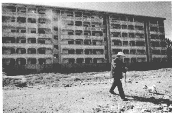
图1-1 玉门市，中国石油的发祥地。1939年8月11日，这里发现了一个日产10吨的油井，成为中国第一口油井。现在，石油枯竭了，城市发展停滞

到国外买石油，要解决三个问题，那就是“能否买得起”、“能否买得到”和“能否运得来”。