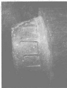
图 1—1 陶文