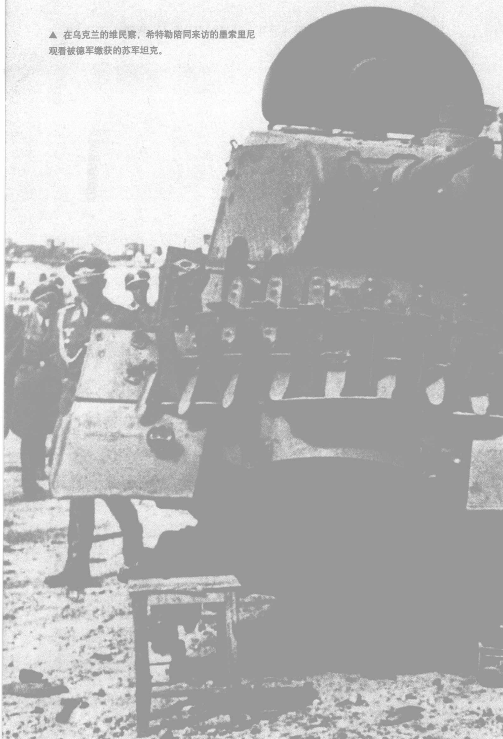
▲ 在乌克兰的维民察，希特勒陪同来访的墨索里尼 观看被德军缴获的苏军坦克。