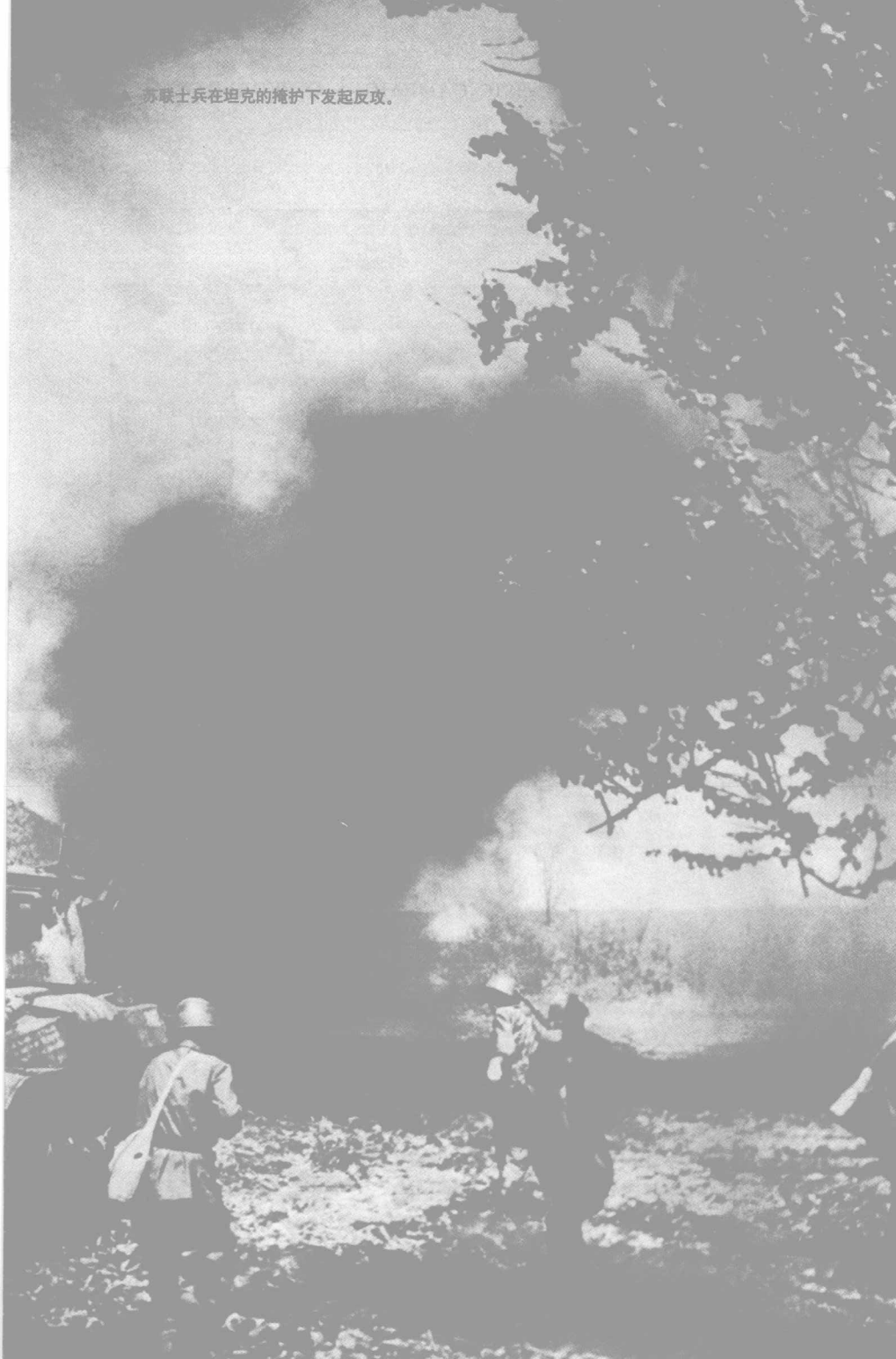
苏联士兵在坦克的掩护下发起反攻。