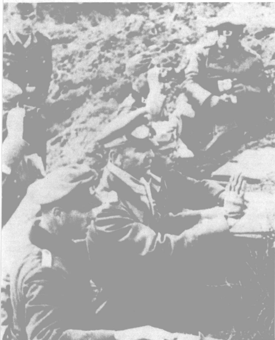
▲ 德国第6集团军司令保卢斯（左二）在斯大林格勒前线指挥战斗。