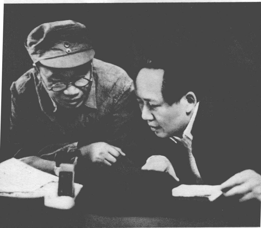
抗日战争时期，毛主席和朱德同志研究作战方针。