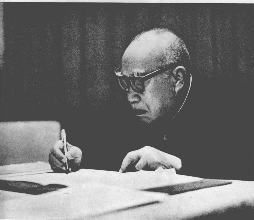
朱德同志努力学习马列著作和毛主席著作（一九七六年四月）