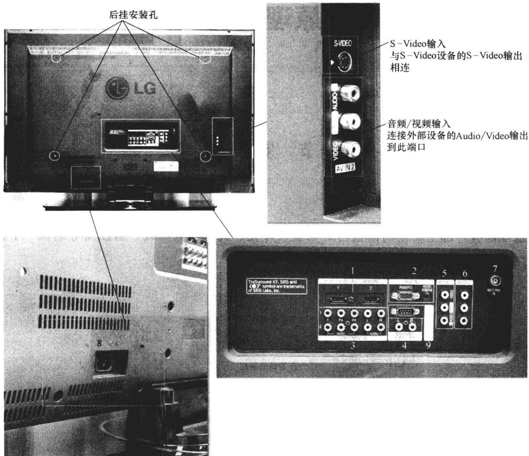
图 1-2 液晶电视后面板

LG 品牌 47LB7RF 型液晶电视为例进行介绍：前面板由液晶屏、控制按键、电源/待机指示灯等组成，如图 1-1 所示；后面板由后挂安装孔、输入端口、输出端口等组成，如图 1-2 所示。