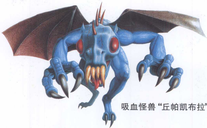
吸血怪兽“丘帕凯布拉”