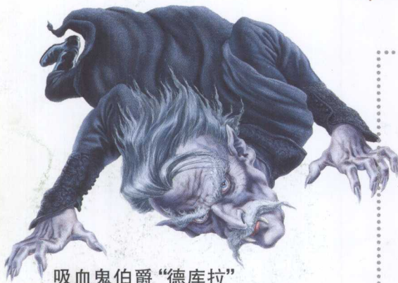
吸血鬼伯爵“德库拉”