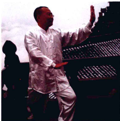
武当山练“太极”：以柔制刚