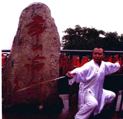
华山舞剑：神武出精神，天人剑合一