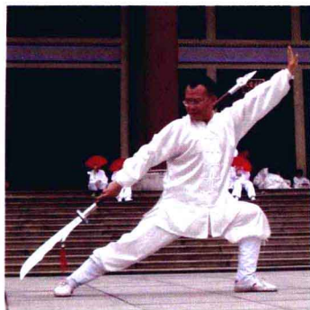
迎北京奥运火炬接力活动武术表演：传递梦想