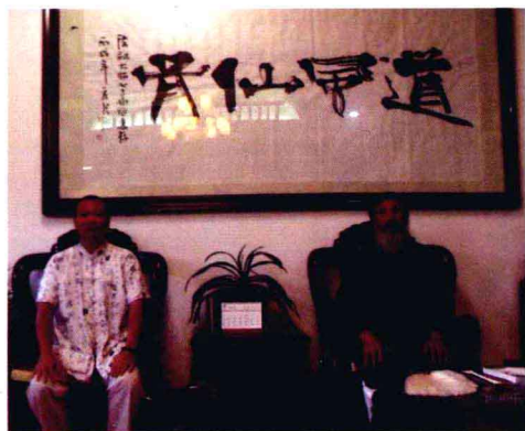
黄智华到终南山楼观台拜访全国政协常委、中国道教协会会长任法融（右）