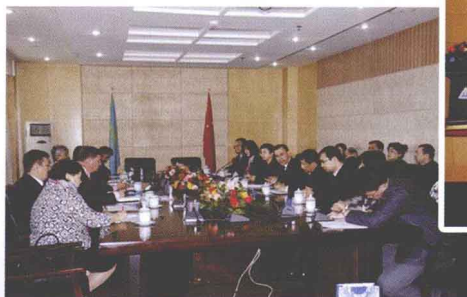
▲ 新疆师范大学领导与阿尔法拉比大学专家座谈