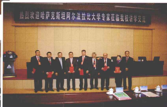
▲ 新疆师范大学向阿尔法拉比大学专家颁发聘书