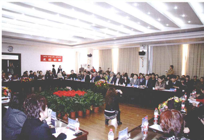
中哈国际学术论坛现场