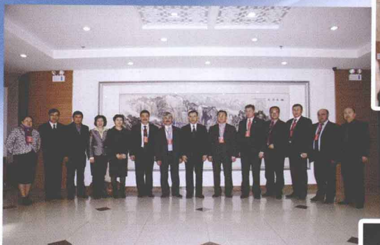
▲ 新疆师范大学校领导及职能部门负责人与阿尔法拉比大学来访专家合影