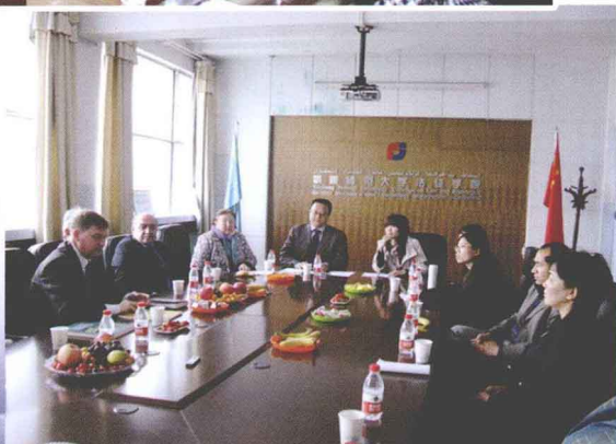
新疆师范大学法经学院与阿尔 法拉比大学法学系商谈研究生 交换事宜