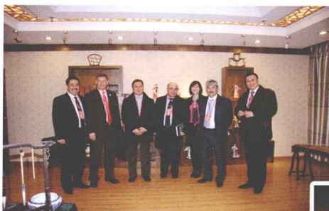
▲ 阿尔法拉比大学来访专家参观留学生公寓, 体验中国元素