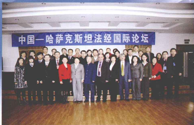
参加国际学术论坛的中哈两国 专家合影