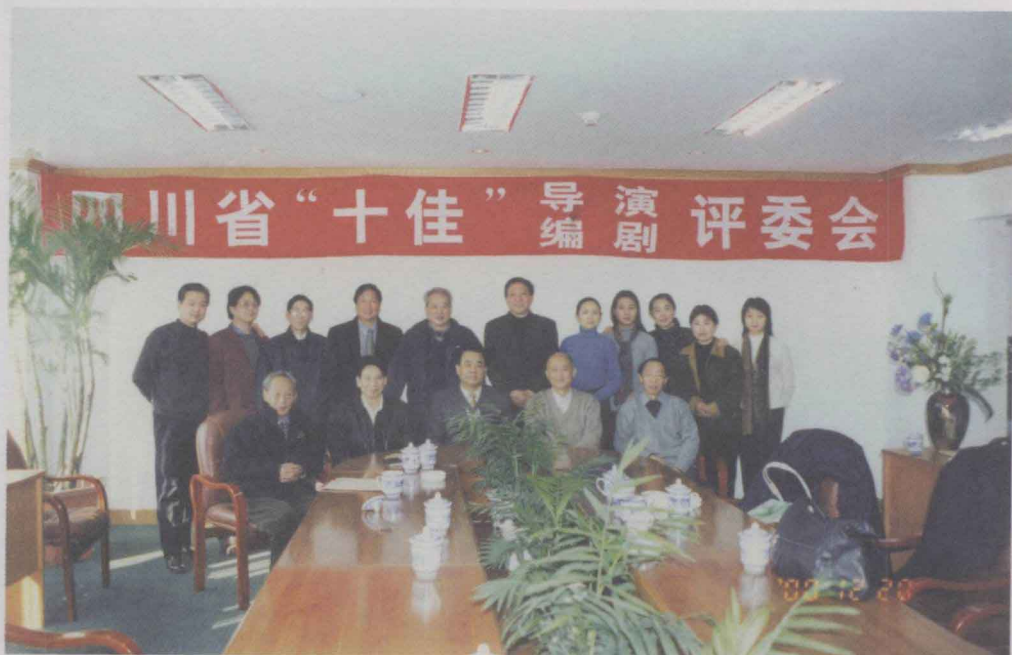
参加四川省“十佳”导演、编剧评委会