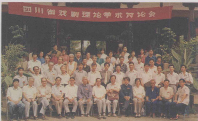
1990年 参加油 江省戏 在加理 理论学 讨论会 于太白 堂前留 影