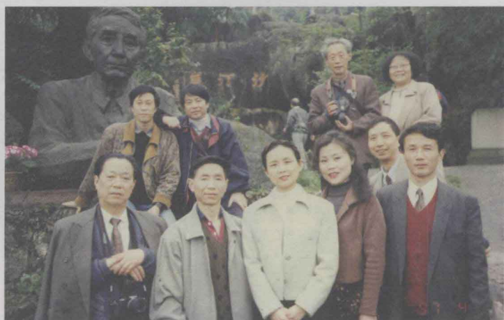
1997年在 沙汀故乡安县 参加四川峨眉 戏剧创作联谊 会时在沙汀塑 像前合影