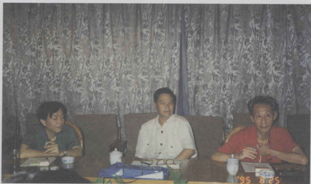
1995年参加四川省委宣传部“五个一工程奖”评委会