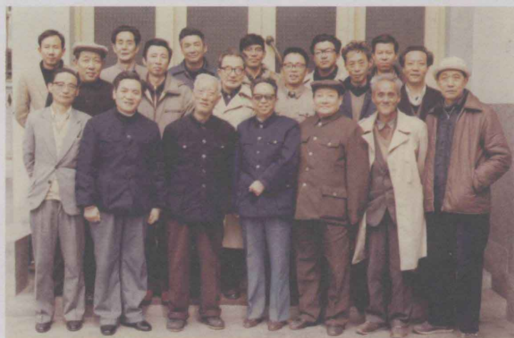
1986年3月参 加四川省剧协在温 江召开的剧本讨论 会，与参会者合影