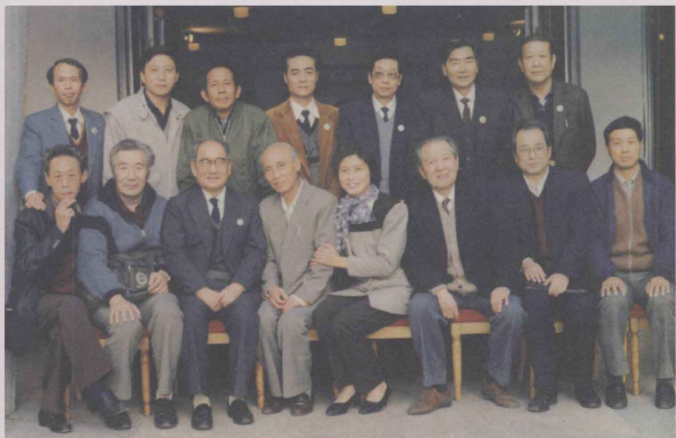
1991年9月，参加首届西南话研会评委会评委合影留念