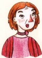
lǎo lao 姥姥 جدة من الأم