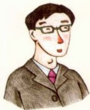
bà ba 爸爸 أب