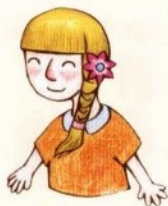
mèi mei 妹妹 أخت صغيرة