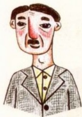
lǎo ye 姥爷 جد من الأم