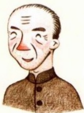
yé ye 爷爷 جد