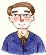
bó bo 伯伯 عم أكبر