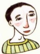
shū shu 叔叔 عم أصغر