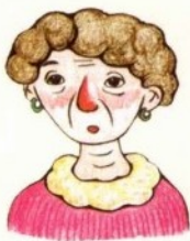
nǚ nai 奶奶 جدة