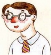
jiù jiù 舅舅 خال