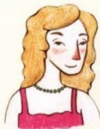
yí mā 姨妈 خالدة