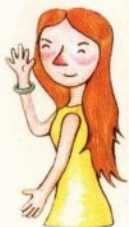
mā ma 妈妈 أم

—في أسرتي أربعة أفراد، أبي وأمي وأخي الصغير وأنا.