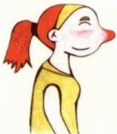
gū gu 姑姑 عمة