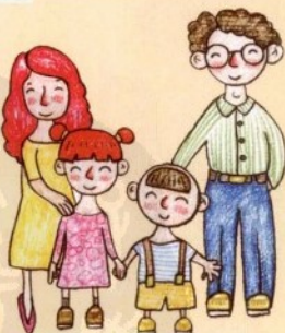
nǚ ér 女儿 بنت