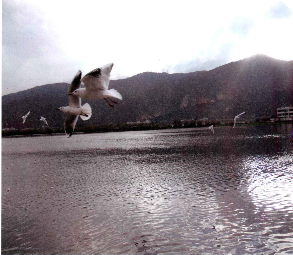
▲ 鸥鸟翔集滇池之上

到昆明旅游，一般首先要去的就是滇池。滇池秀丽的风光、迷人的景色吸引了无数的中外游客，被称为云贵高原上的一颗明珠。