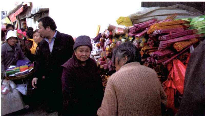
▲圆通寺旁热闹的香火一条街

通常我是游完了云南各处的古村古镇等名胜古迹后，回到昆明准备返回时，才到圆通寺。记得最后一次到昆明，我从汽车站直接乘车到圆通寺，花了一个多小时，得以饱览昆明市区的街景和现代建筑。