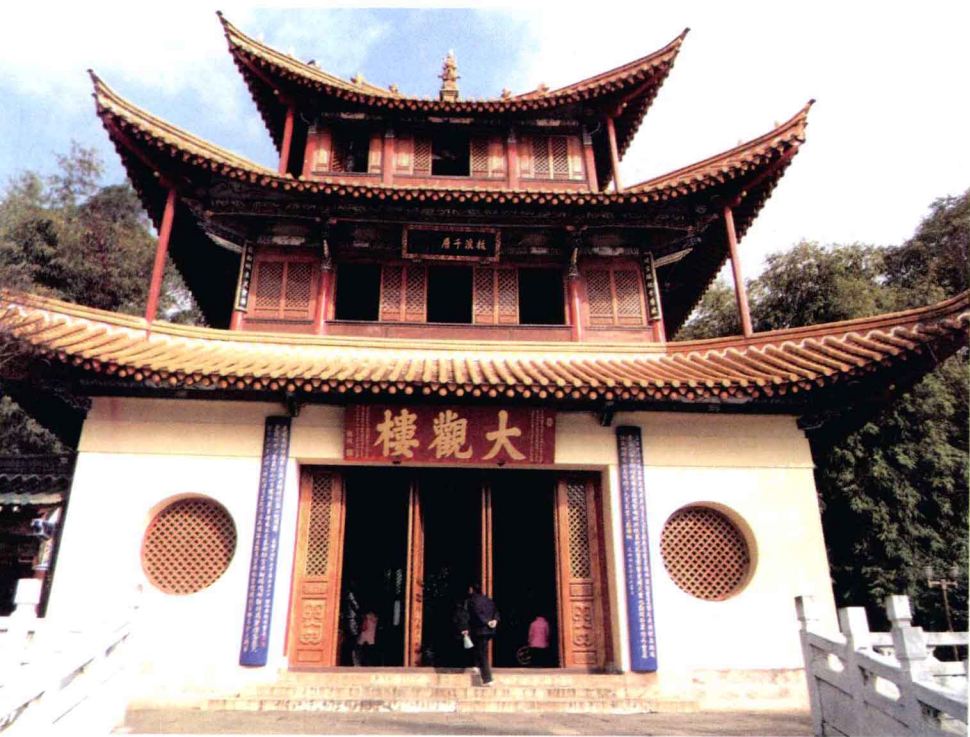
▲大观楼正面，门边是著名的长联

数千年往事，注到心头。把酒凌虚，叹滚滚英雄谁在？想：汉习楼船，唐标铁柱，宋挥玉斧，元跨革囊。伟烈丰功，费尽移山心力，尽珠帘画栋，卷不及暮雨朝云；便断碣残碑，都付与苍烟落照。只赢得：几杵疏钟，半江渔火，两行秋雁，一枕清霜。”