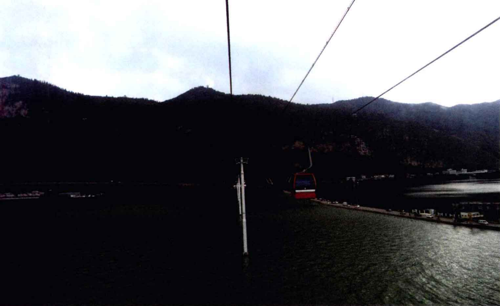
▲滇池上也架起了缆车，不知是该喜，还是该忧