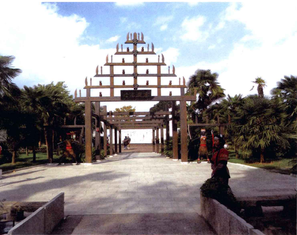
▲ 云南民族村中的哈尼族寨

走进云南民族村里，可见不同风格的民族村寨分布其间，错落有致。这里有吉祥的傣寨白塔，壮观的白族大理三塔，高耸的彝家图腾柱，源远流长的纳西东巴文化，还有佤族的木鼓、基诺族的太阳鼓、拉祜族的芦笙舞、景颇的木脑纵歌、壮族的铜鼓文化，此外，还有布朗族的婚俗、雪域高原的藏族佛寺、哈尼族的龙巴门、德昂族的龙阳塔、奇特的摩梭人母系氏族社会遗存，以及风趣的亚洲群象表演、精美独特的民族风味美食……可以说是云南民族文化的缩影，很适合时间有限的外来游客。