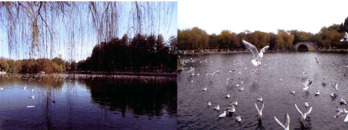
▲海鸥在湖面上云集

如果想要赏花观鸟可以去翠湖公园看看。翠湖公园位于昆明市区的螺峰山下，云南大学正门对面。虽然面积不算太大，但很有特色。这里最初曾是滇池中的一个湖湾，后来因为水位下降而成为一汪清湖。从1985年起，每年冬季都有大量海鸥从西伯利亚飞到昆明过冬，其中有一部分就在翠湖栖息。每年这时候，逛翠湖赏海鸥便会成为昆明人以及许多外地游客的一大乐趣。