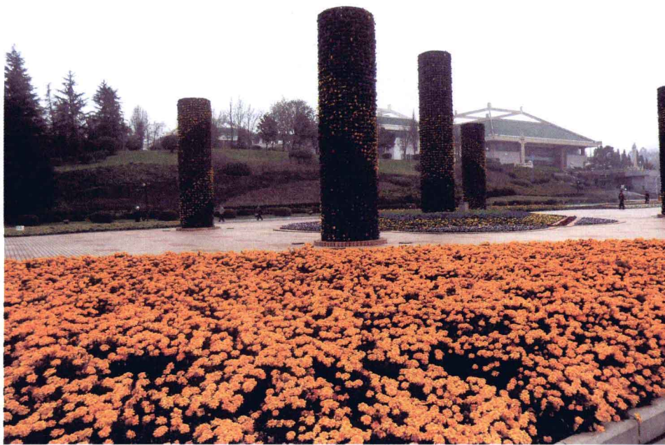
▲昆明世界园艺博览园园景

另外，如果时间充裕，位于昆明东北郊金殿风景名胜区的昆明世界园艺博览园也是值得一去的。昆明世界园艺博览园是一个汇集了全世界园艺风景的超大型博览场所，距昆明市区约4公里，市区东南西北各汽车站均有专线车，交通很方便。