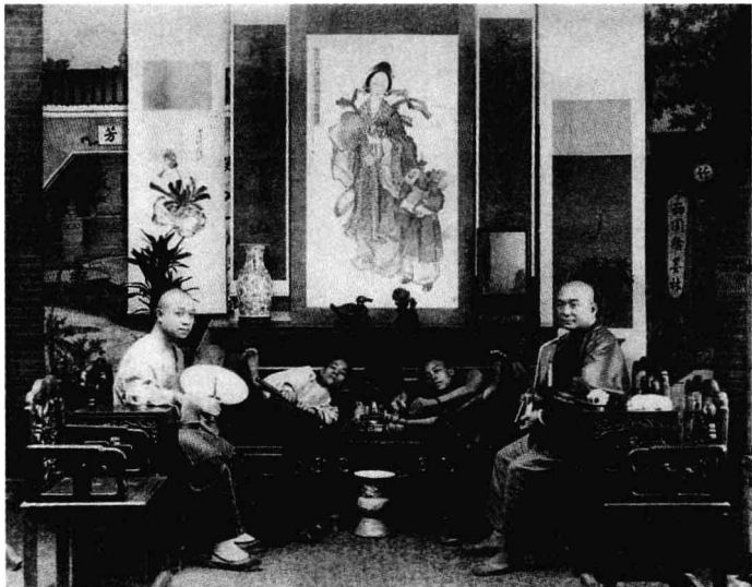
晚清时，中国人认为抽鸦片是一种高档享受。

5月18日，收缴鸦片共21306箱，比义律承诺的数目还多1000多箱。禁烟阶段性任务完成。5月24日，颠地和义律等人离开广州，其后义律拒绝