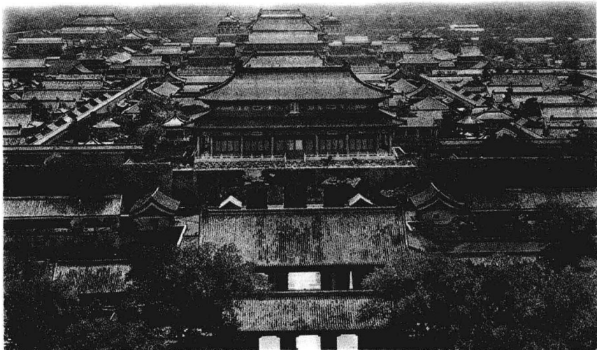
晚清时的北京城，见证了一个王朝的衰败

齐暗究可哀！我劝天公重抖擞，不拘一格降人才。”他希望借助天公的雷霆之气，冲破这层笼罩着中国的鸦片烟雾，让人存有些许安慰和希望。近代中国的序幕，从林则徐这个福建教师的儿子走出京城后，就正式拉开了。