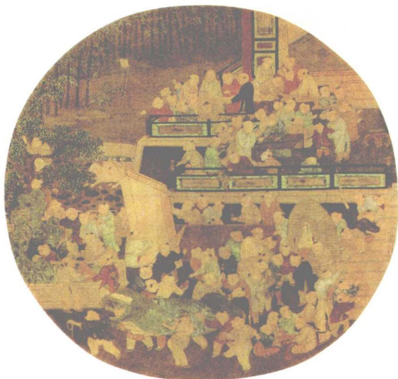
百子嬉春图。孟子认为，婴儿刚刚出生时，本性都是善良的，但是经过后天教育以及环境的影响之后，才有了善恶之分，因此，后天学习对一个人的成长至关重要。

雨施行，然后万物化生。此以天道言之也。以人道言之：男以阳气下降，女以阴气上升，阴阳交会，云雨施行，父精母血，成其胎元。待等胎元以满月，逮当生出其母胎，是男是女。称之曰人。