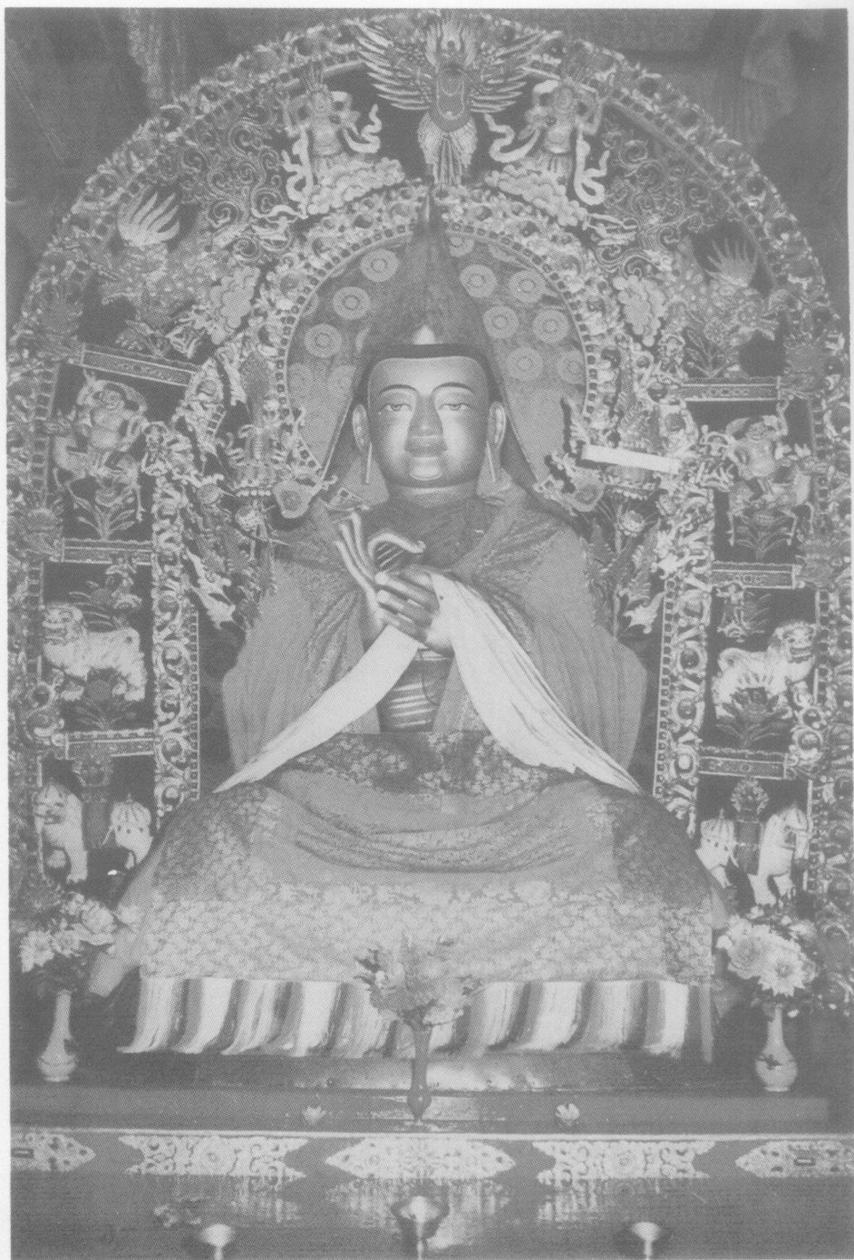
塔爾寺宗喀巴大師像