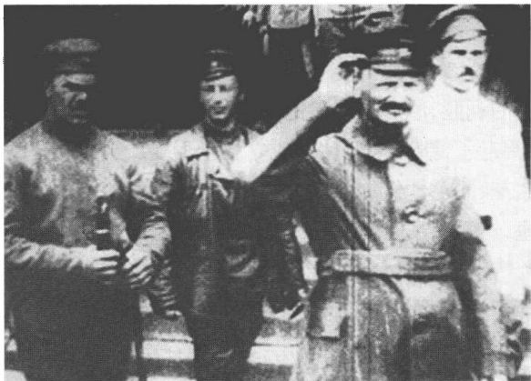
► 1919年，红军领导人里昂·托洛茨基在波兰前线。

1919年2月契卡成立特别部，其主要任务是确保红军听从党的指挥。特别部随军行动，有权决定军队的行动，违反特别部命令者将被处决。为了作战需要，红军领导人托洛茨基在军队中设立了情报组织。1918年6月13日，红军成立东方战线注册部，负责东方战线的军事情报工作。注册部拥有当时最现代化的侦察手段——航空侦察，并很快建立了一个高效率的谍报网，直接为作战服务。此后，其他战线也成立了各自的注册部。