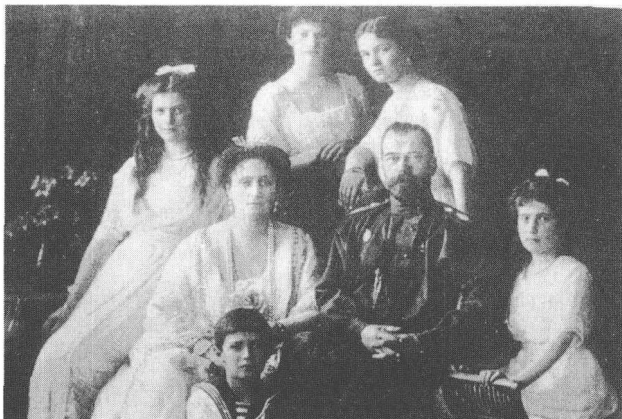
◀ 末代沙皇尼古拉二世的全家福。

一家人围坐在火炉旁，等待着来自彼得堡的消息。西伯利亚虽好，可毕竟故土难离啊。克伦茨基曾经答应过，局势一有好转，就把他们接回欧洲。重新登位已不可能，但是，过上比较好的生活，那还是可以指望的。