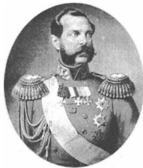
沙皇亚历山大二世