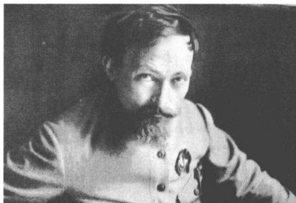
契卡之父 捷尔任斯基

捷尔任斯基是一个非常正直的人,为了革命的理想,他既能牺牲自己,也能牺牲他人。他曾经说过:“我从未顾惜过我自己,这也是我的力量所在。”他的后继者、戈尔巴乔夫时代的克格勃主席切布里科夫则赞美他说:“费里克斯·捷尔任斯基力图根除世界上的不公正和犯罪,向往着有朝一日,战争和民族仇恨会永远从我们的生活中消失。他总是恪守着自己的信条,这种信条就体现在他的言语中:‘我想拥抱全人类,向她倾注我的爱,温暖她,洗净她身上现代生活的污垢。’”