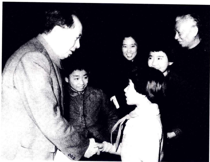
毛泽东与刘少奇、王光美一家。