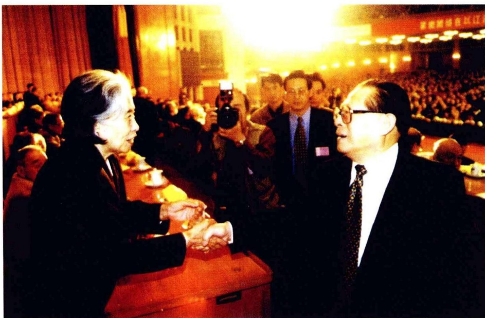
江泽民与王光美亲切握手。