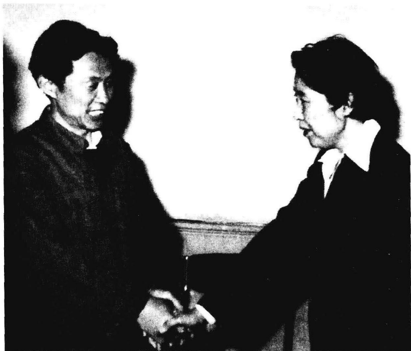
1980年5月13日王光美与作者在开封刘少奇逝世处。

从开封火葬场出来，王光美一行驱车进入市区，来到刘少奇被“监护”的北土街10号市政府北院。走进小门，看到那四面楼房环抱的天井院和那金库的铁栅，她向周围的人们说：“这里真像一座监狱啊！”