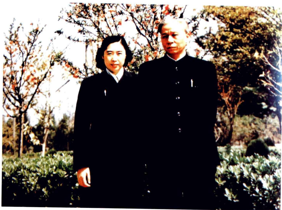
刘少奇、王光美合影。