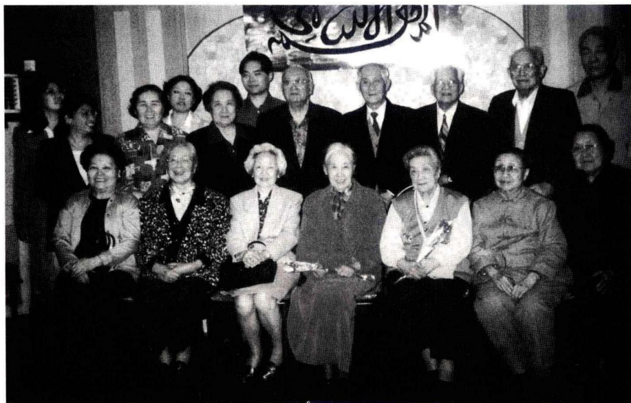
2000年王光美合家合影。

(前排左起：六嫂应伊利、三嫂严仁英、五嫂张锡瑾、王光美、二嫂胡敏、四嫂王新、王光正 中排左二起：王光平、王光和、王光英、王光复、王光超、王士光。)