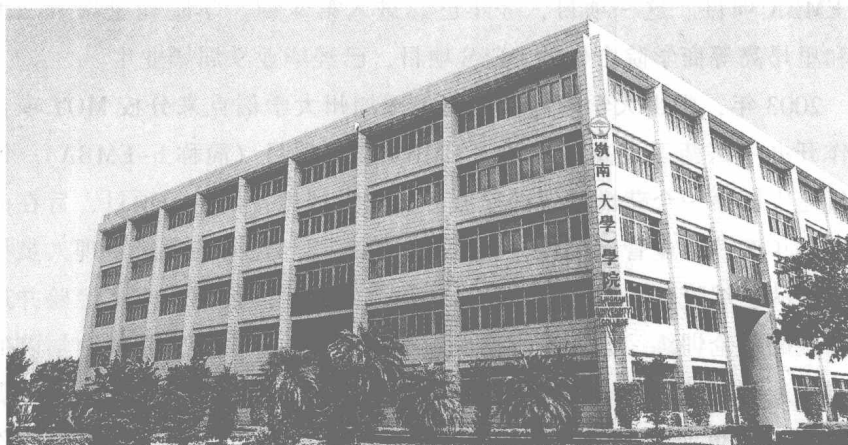
中山大学岭南学院林护堂

中山大学岭南（大学）学院源于岭南大学。原岭南大学是1888年由美国友好人士在广州创办的一所私立大学，在海内外具有广泛影响，并和世界上一些著名大学互相承认学历。在1952年的全国院系调整中，