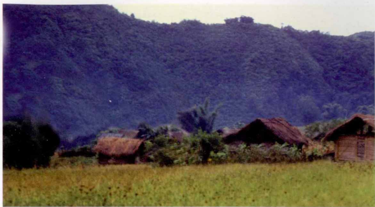
翠竹掩映的门巴村寨