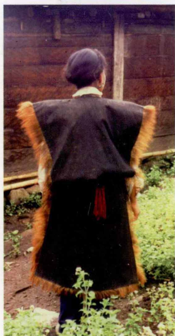
达木珞巴妇女猴皮服装(背部)