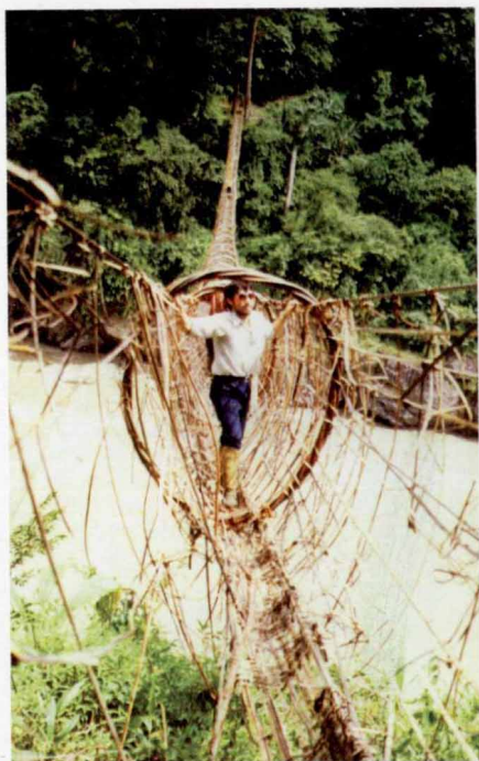
雅江上的藤网桥(作者过藤网桥)