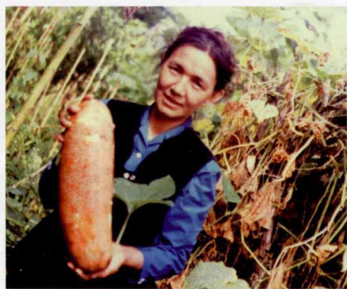
收获喜悦(手上所抱乃墨脱产的大南瓜)