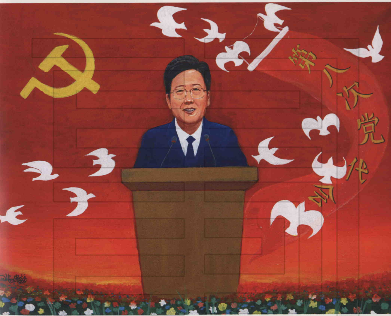
绘画 吐尔洪江·赛依都拉