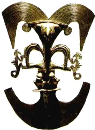
黄金艺术品——这是在哥伦比亚首都波哥大黄金博物馆里拍摄的古代美洲文明的精美黄金艺术品。

在哥伦比亚的波哥大市立银行里，有一具黄金制造的模型，似乎是一种航天器。过去考古学家认为这是祭神用的宗教器具，雕的可能是鱼或是飞鸟的形象。后来经过纽约航空研究所的风洞测试，竟然非常符合飞行标准。专家们认为：这件东西不是鱼或鸟的形象。这件黄金模型是从哥伦比亚的内陆深处出土的，那些艺术家从来没有看见过一种咸水鱼类，而且也没有人会想象有这样几何形翅膀和高耸垂直安定翼的鸟类。这种黄金制品的作者设计的应该是飞行器，而不是鱼或飞鸟。在几百年甚至几千年前，人类怎么会制造这样合乎飞行标准的飞行器呢？