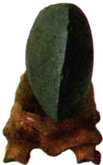
考古挖掘遗址中的文物

加工金属的精度达到微米？古人留下的放射性物质痕迹说明了什么？古代的飞行器如何应用了汞和钛？