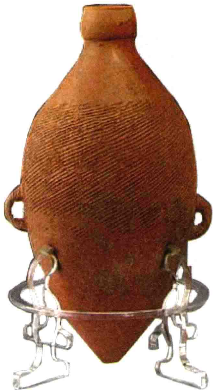
考古挖掘遗址中的文物