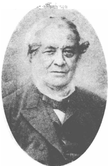
(23) Robert Wilhelm Bunsen 本生 1811—1899