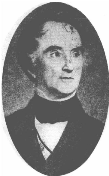
(21) Justus Liebig 李必虚 1803—1873