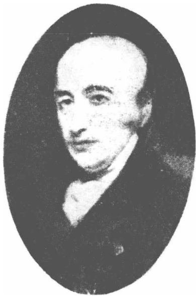
(9) William Hyde Wollaston 邬列斯敦 1766—1828