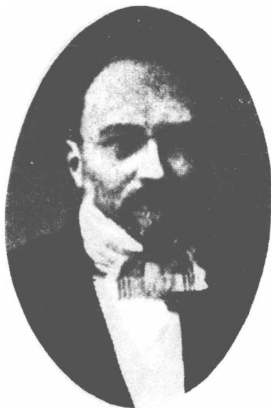
(18) Carl Gustav Mosander 毛山德 1797—1858