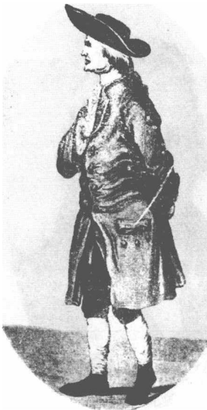
(3) Henry Cavendish 凯文第旭 1731—1810