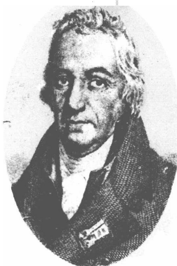
(8) Claude Louis Berthollet 贝叟来 1748—1822