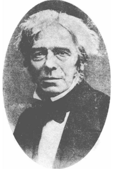
(16) Michael Faraday 法拉第 1791—1867