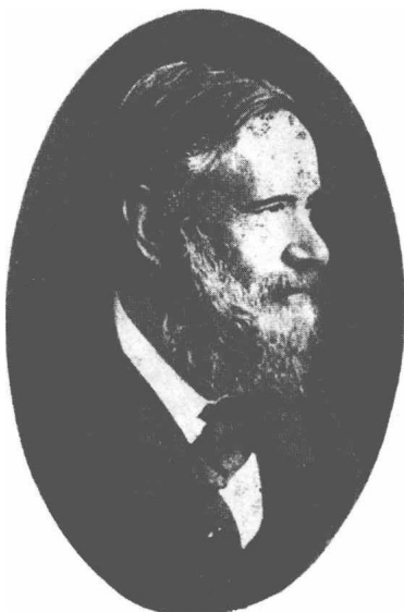
(31) Stanislaw Cannizzaro 坎尼日娄 1826—1910