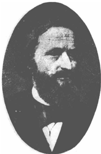
(29) Gustav Robert Kirchhoff 克品多夫 1824—1887