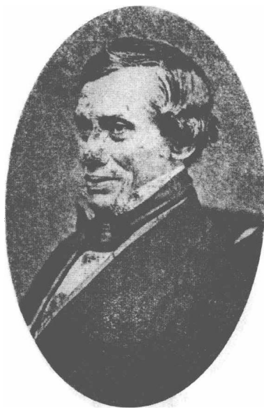
(22) Thomas Graham 格兰亨姆 1805—1869