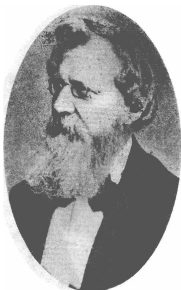
(26) August Wilhelm Hofmann 侯夫门 1818—1892