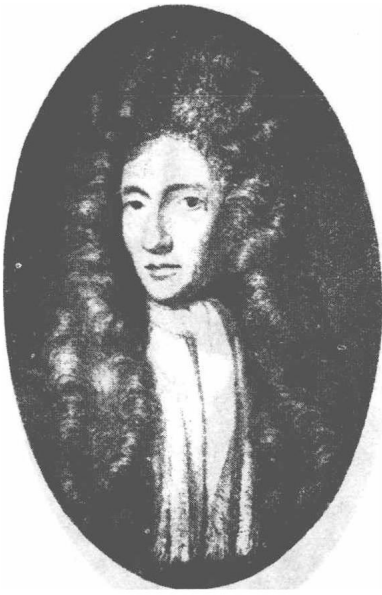
(1) Robert Boyle 包宜尔 1627—1691