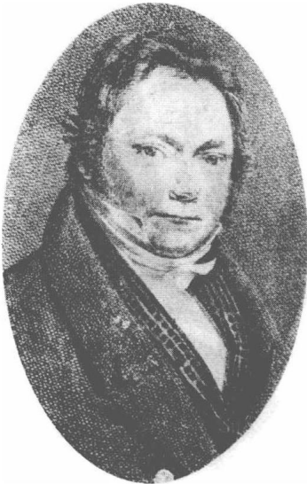
(15) Jöns Jakob Berzelius 白则里 1779—1848