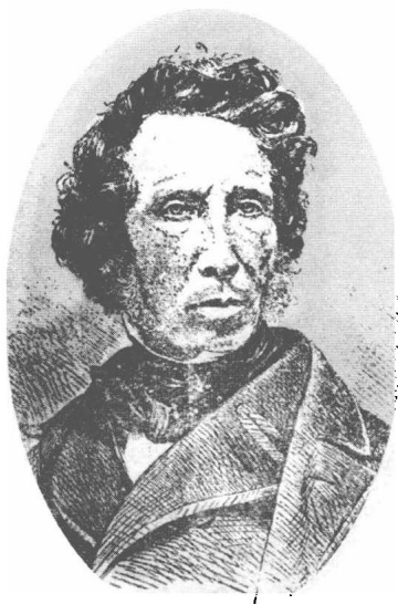
(19) Friederich Wöhler 孚勒 1800—1882