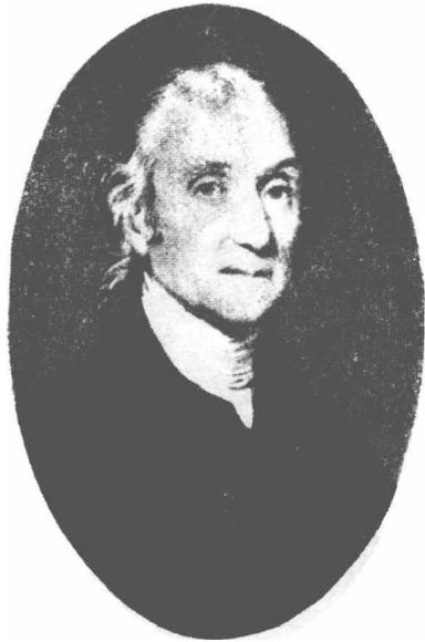
(4) Joseph Priestley 普力司列 1733—1804