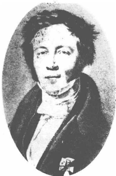
(17) Eilhardt Mischerlich 米学礼 1794—1863