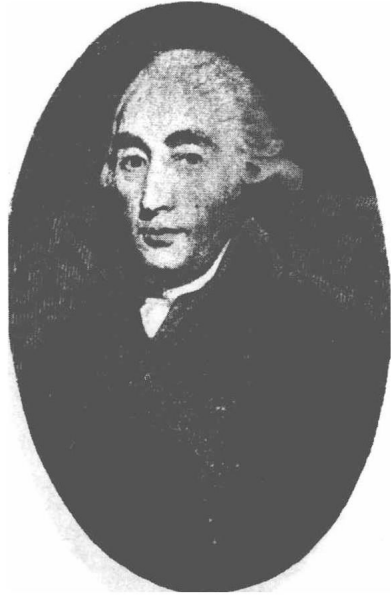
(2) Joseph Black 卜拉克 1728—1799