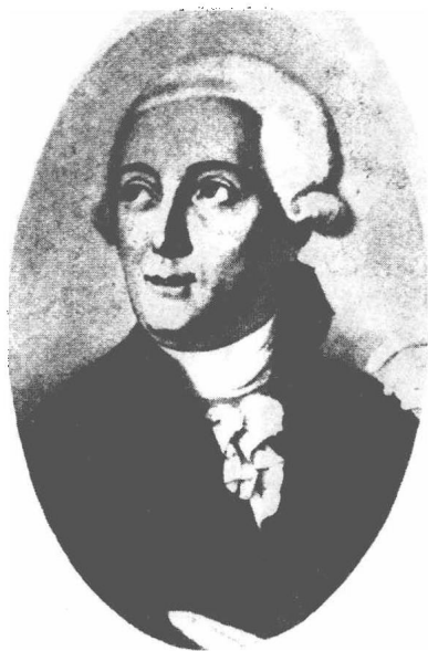
(6) Antoine Laurent Lavoisier 赖若西埃 1734—1794