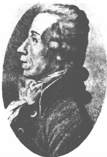
(7) Martin Heinrich Klaproth 柯列普老 1743—1817