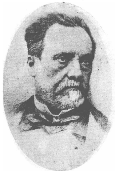
(28) Louis Pasteur 巴斯德 1822—1895