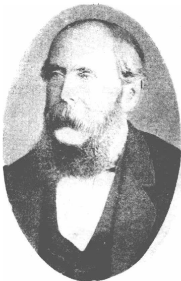
(24) Jean Servais Stas 许台 1791—1867