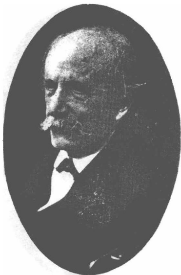
(32) Pierre-Eugene Marcellin Berthlot 贝提老 1827—1907