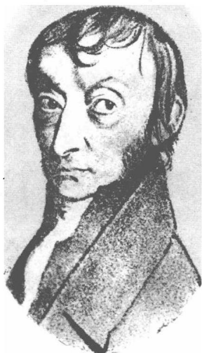
(11) Amadeo Avogadro 阿佛盖路 1776—1856