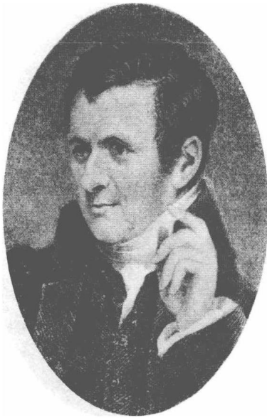
(13) Humphry Davy 兑飞 1778—1829