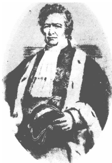
(12) Louis Jacques Thénard 戴纳 1777—1857