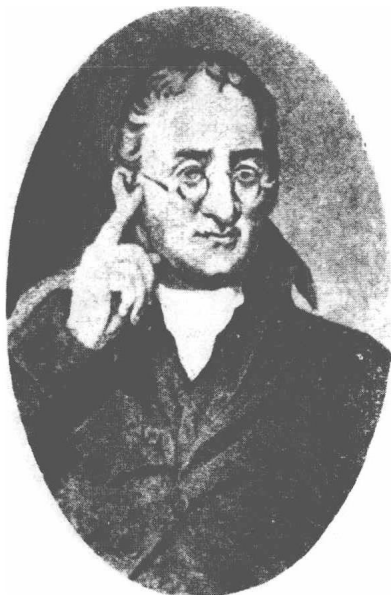
(10) John Dalton 多顿 1788—1844