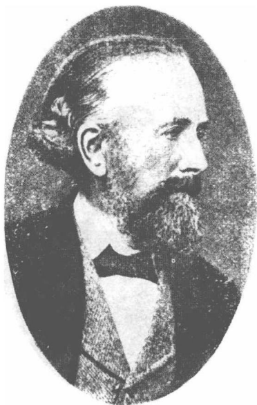
(30) Edward Frankland 弗兰克伦 1825—1899