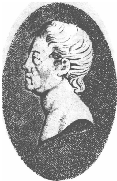
(5) Karl Wilhelm Scheele 许礼 1724—1783