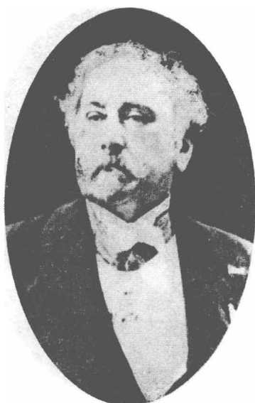
(27) Alexander E. Beguyer de Chancourtois 项古藁 1820—1886