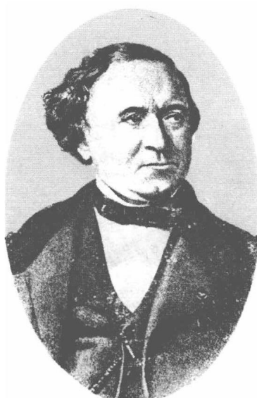
(20) Jean Baptiste Dumad 杜玛 1800—1884