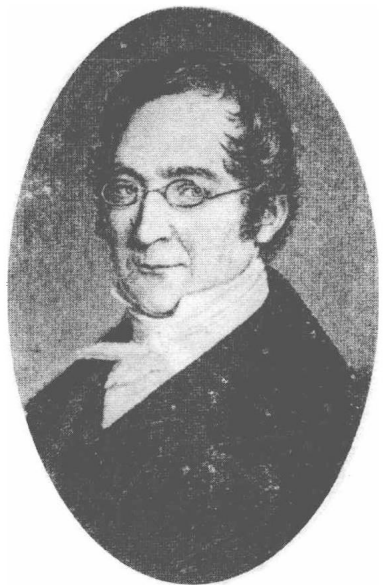
(14) Joseph Louis Gay-Lussac 盖路赛 1778—1850