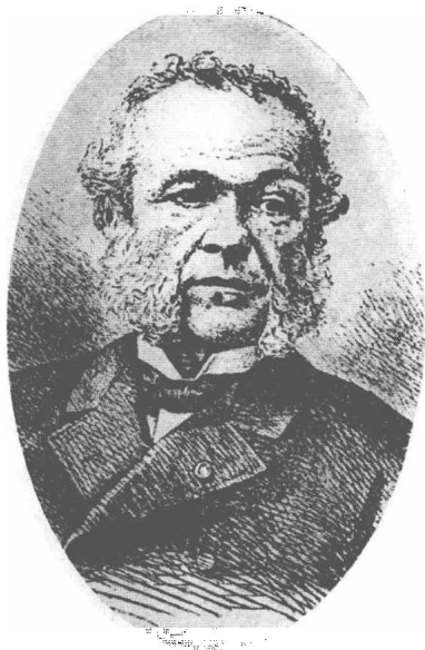
(25) Charles Adolphe Wurtz 费慈 1817—1894