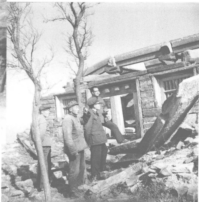
1983年中原神话调查组在风后岭山顶考察。