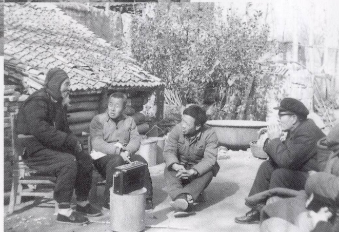
1983年中原神话调查组在灵宝夸父山采访。