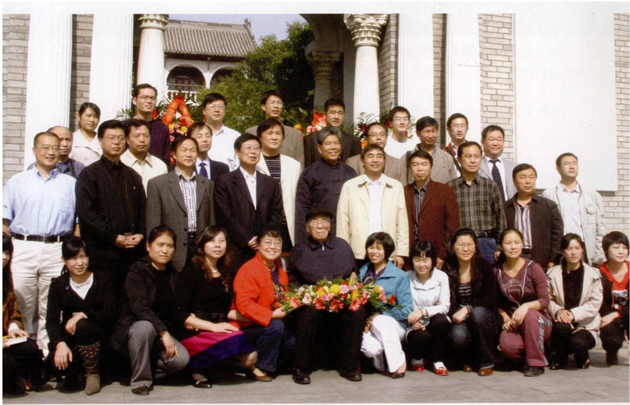
参加张振犁先生学术思想研讨会的代表合影。