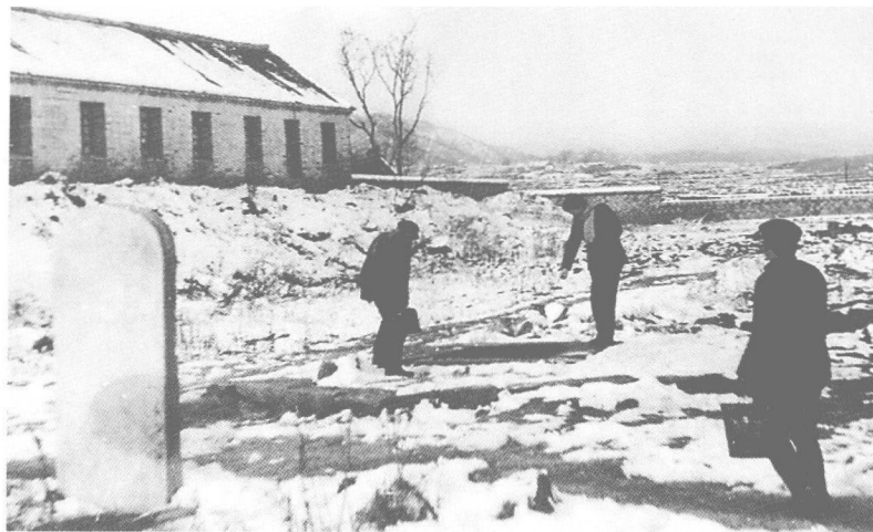
1983年中原神话调查组考察桐柏禹王锁蛟井和淮源碑。