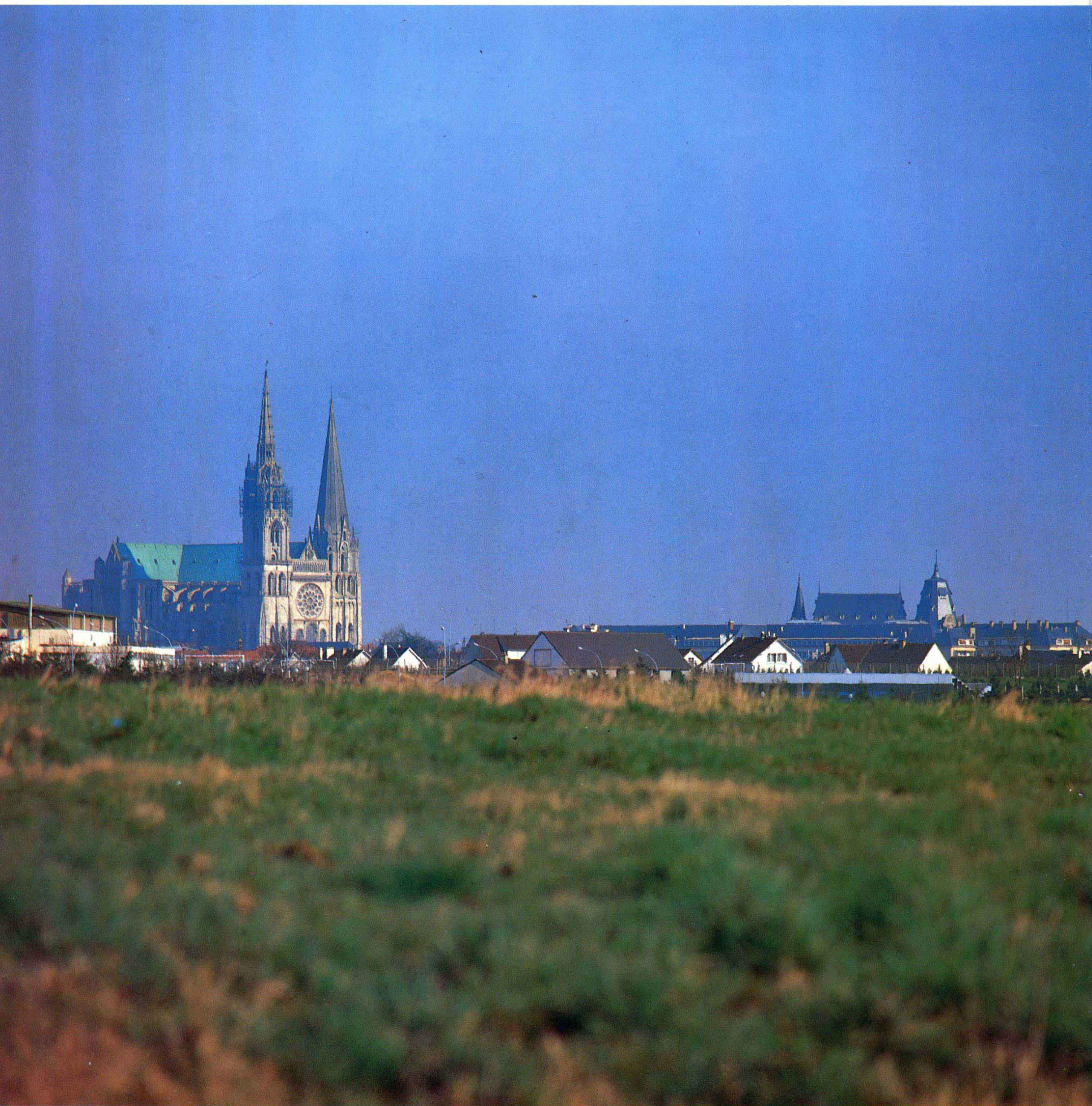
5 沙特爾大教堂(聖母院)遠望 沙特爾(法國)