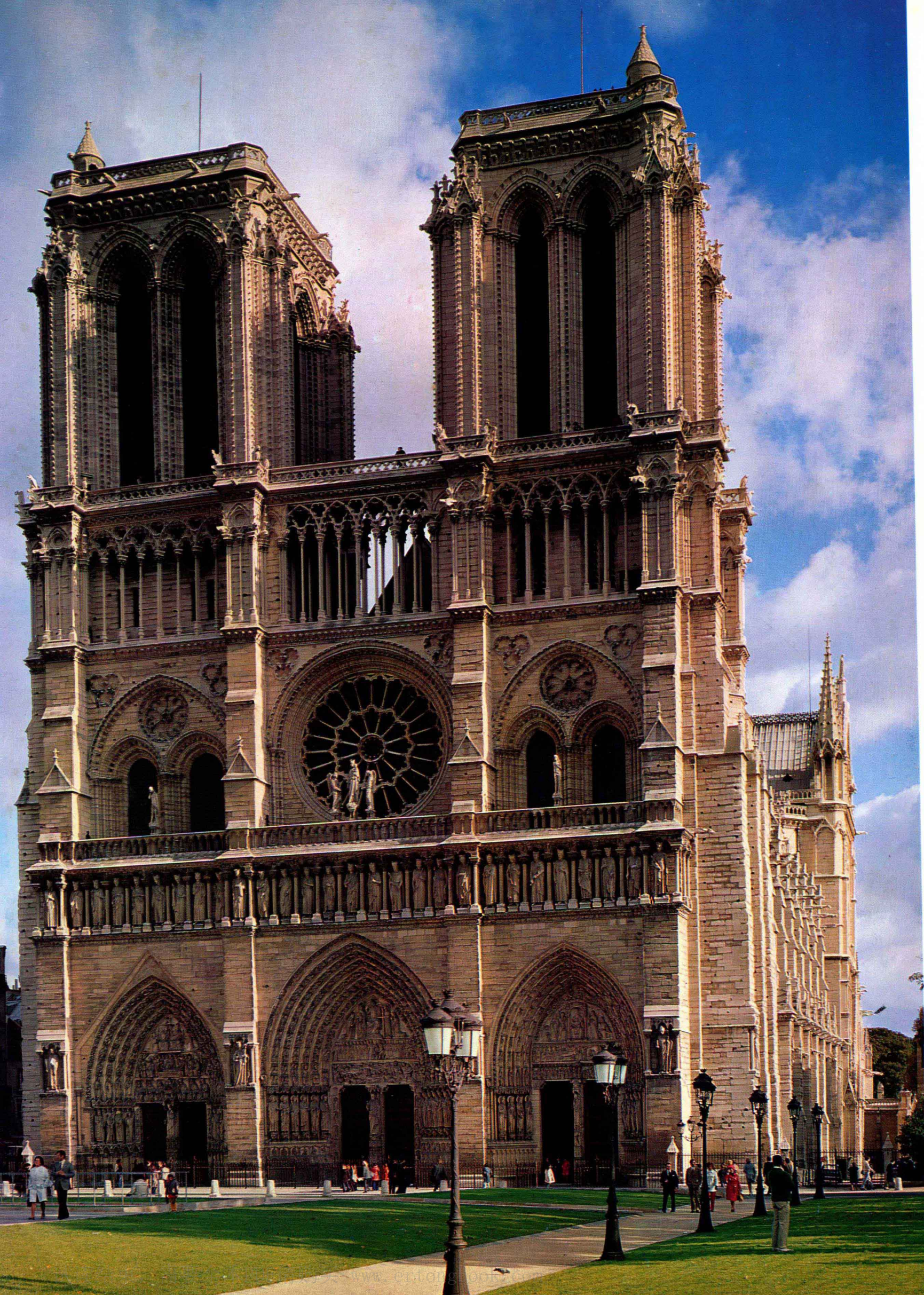
1 巴黎大教堂（聖母院）西正面 西元1163年左右—1250年左右 巴黎