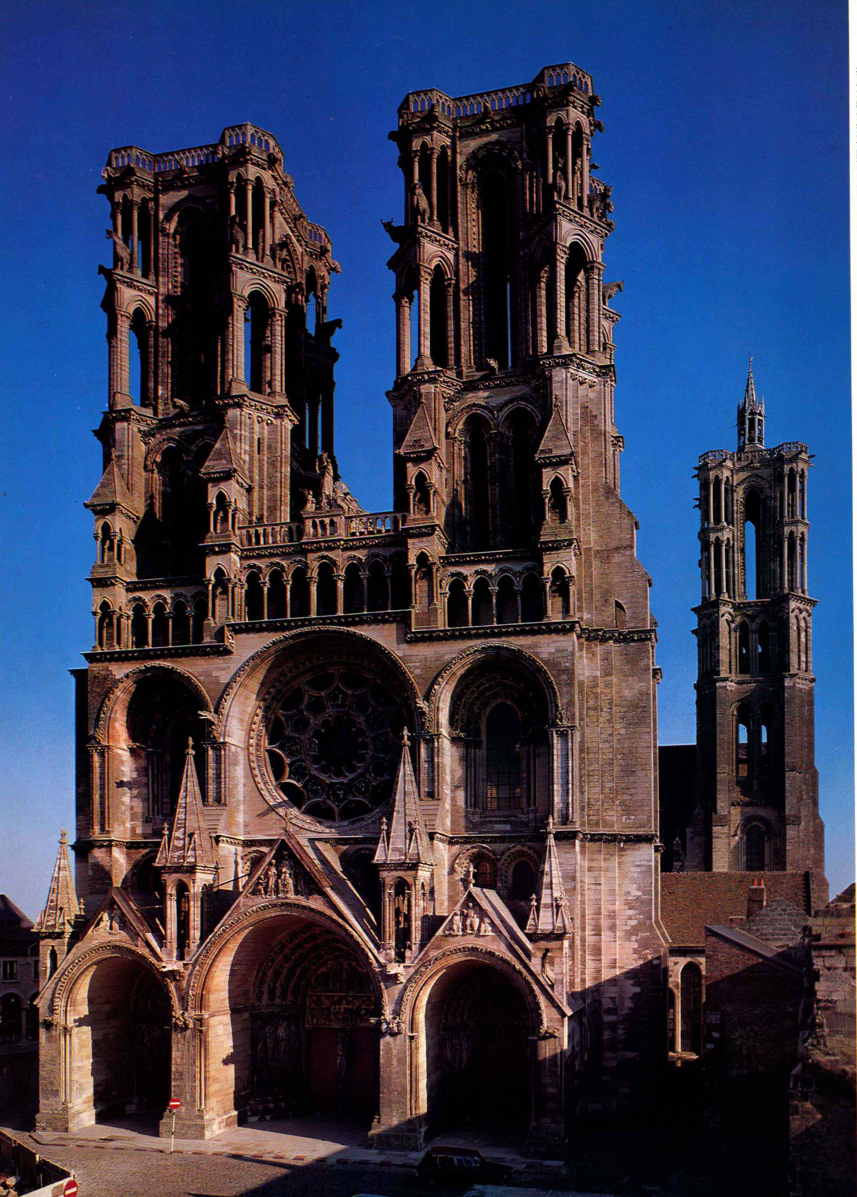
3 4 拉恩大教堂(聖母院)主堂內部 拉恩 拉恩大教堂(聖母院)西正面 西元1160年左右~1230年左右 拉恩(法國)