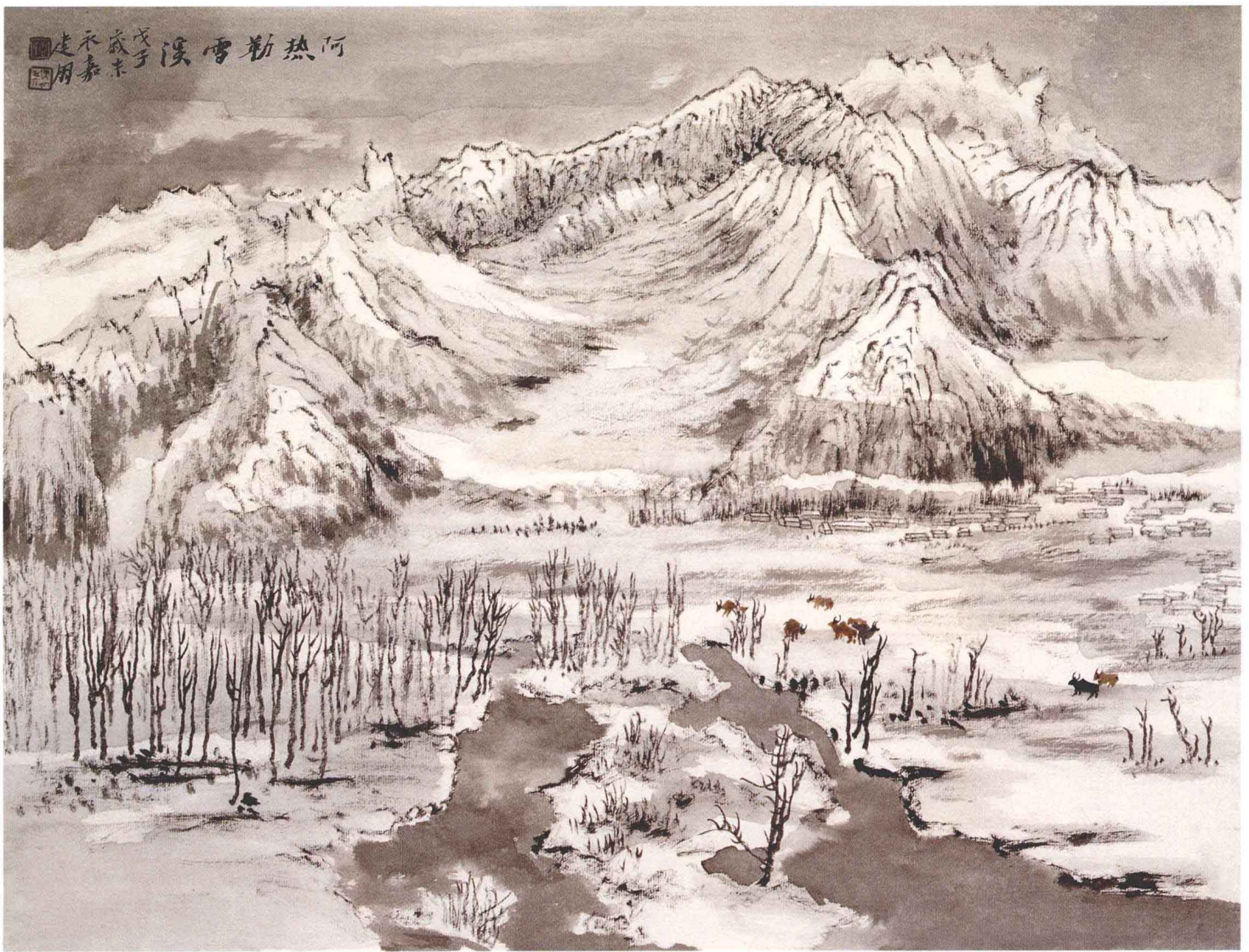
雪溪图 41cm × 55cm 纸本 2009年