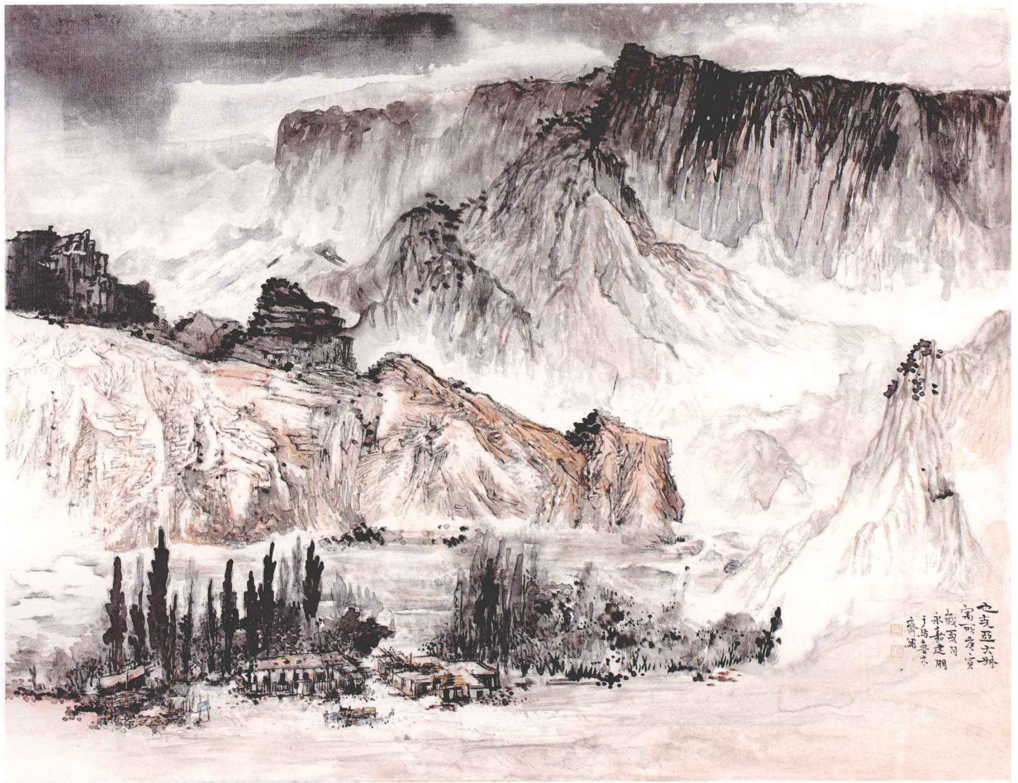
也可亚大叔寓所 70cm × 90cm 布本 2010年