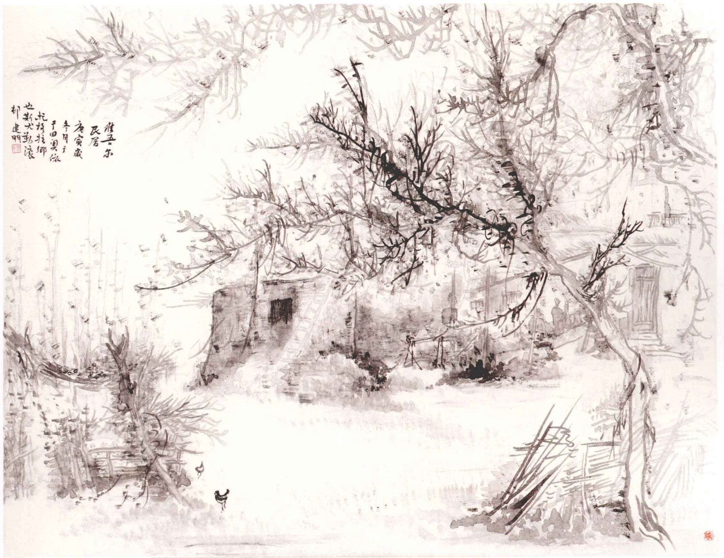
维吾尔民居 70cm × 90cm 布本 2010年