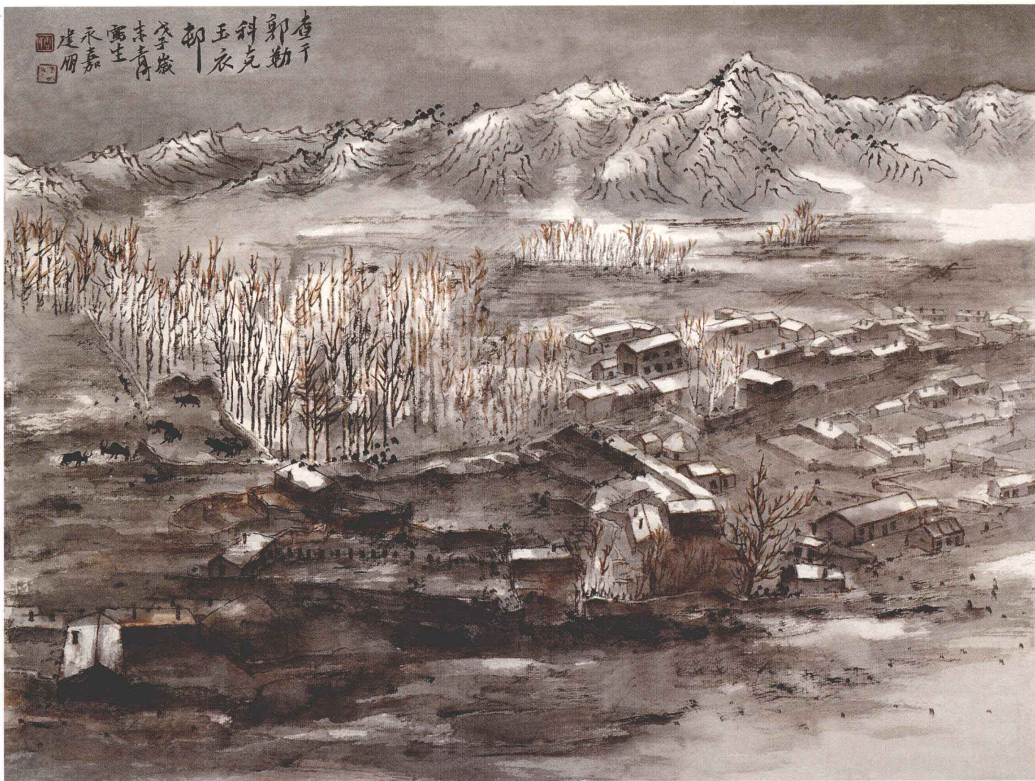
查干郭勒 41cm × 55cm 纸本 2009年