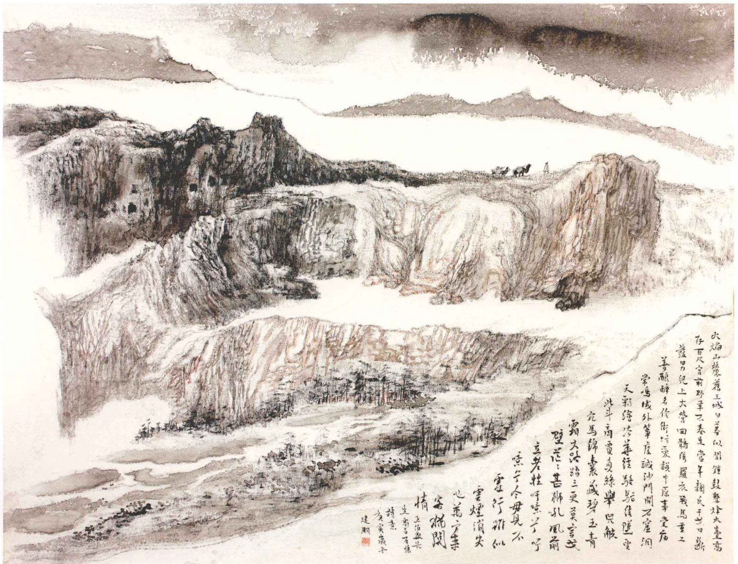
火焰山下旧王城 70cm × 90cm 布本 2010年