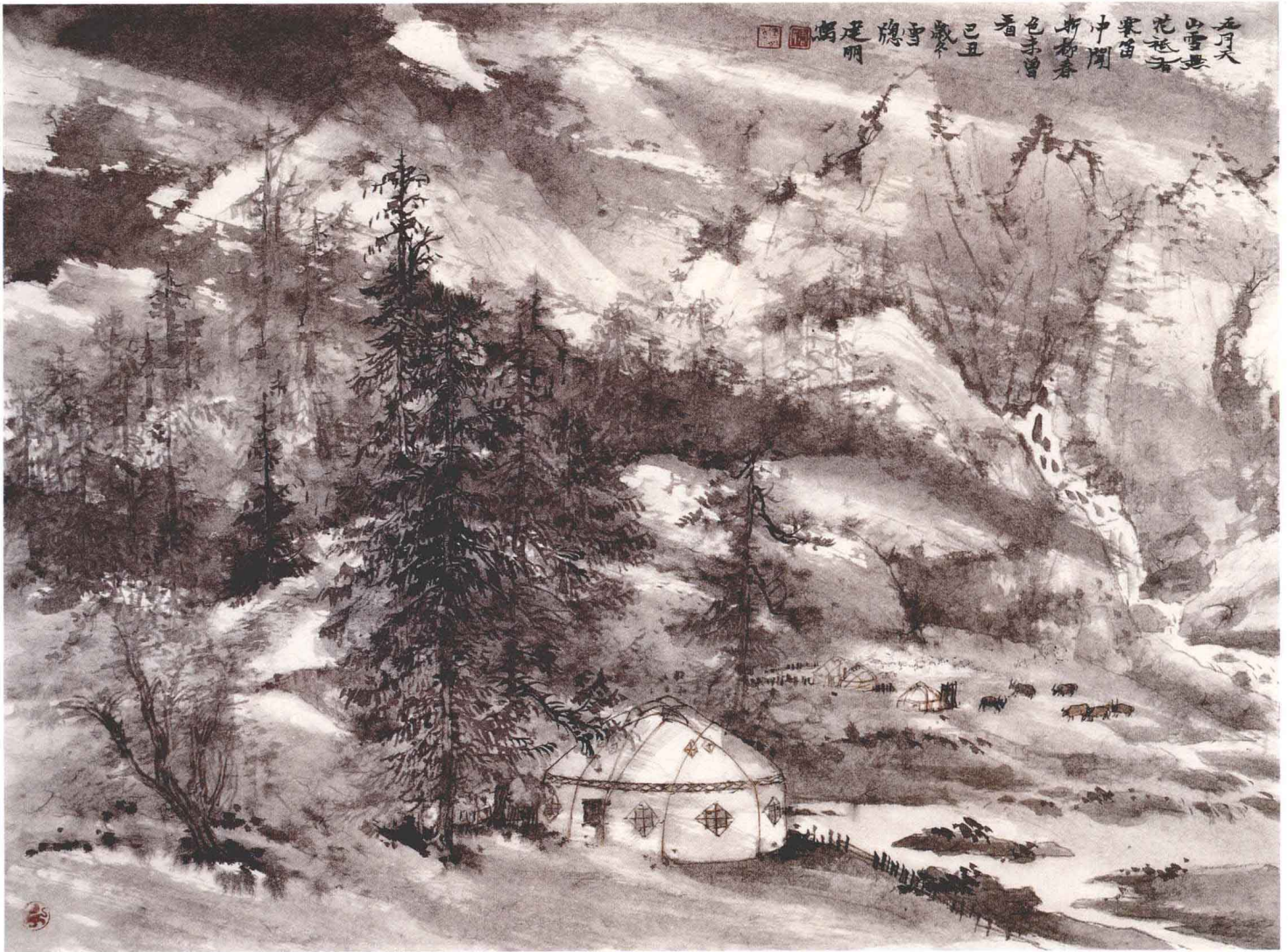
五月天山雪（附局部） 41cm × 55cm 纸本 2009年

款识： 五月天山雪， 无花只有寒。 笛中闻新柳， 春色未曾看。 己丑岁冬雪窗， 建朋写。