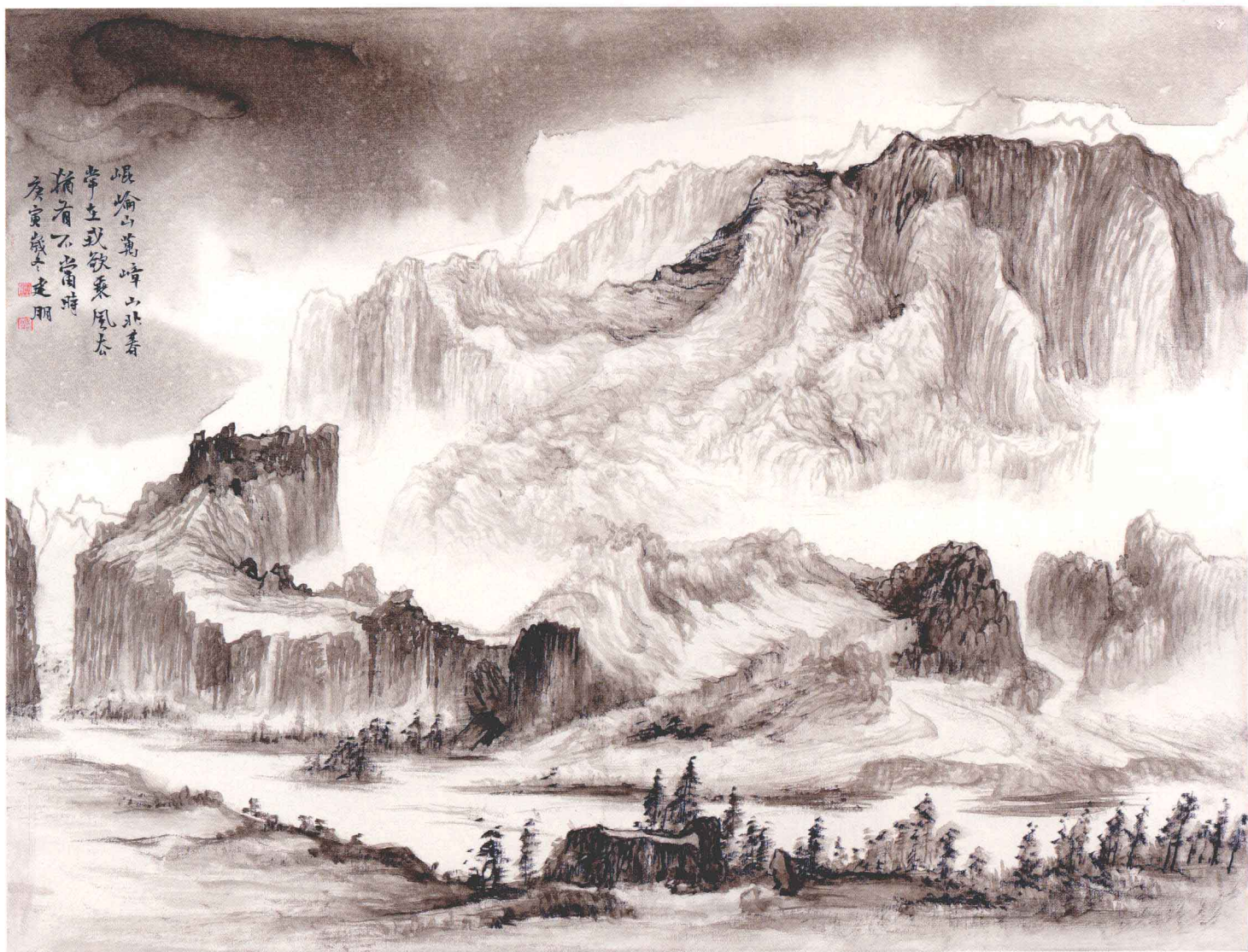
昆仑山万丈 70cm × 90cm 布本 2010年