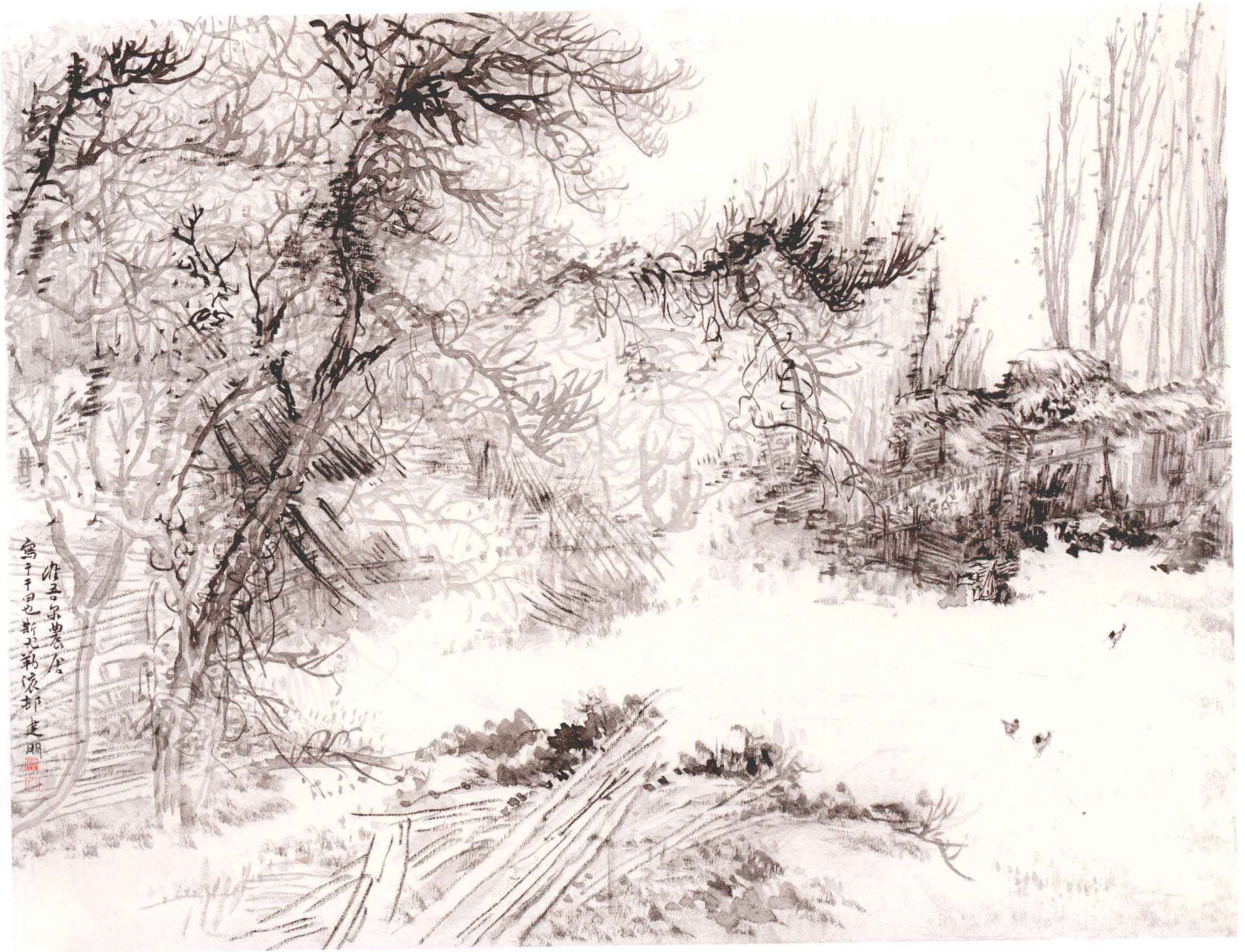
维吾尔农舍 70cm × 90cm 布本 2010年