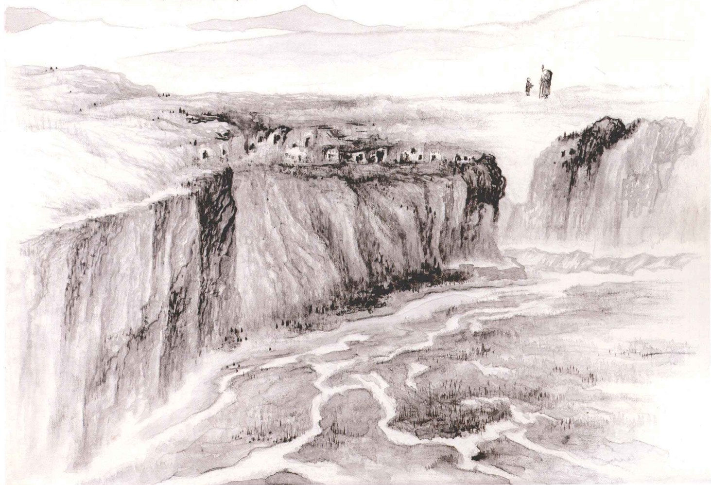
異域逢君 70cm × 90cm 布本 2010年

異域逢君本 不期 湛然深 恨識君遲 清詩厭世光 千古 逸筆驚 人自一時 字老本來遵 雅淡 吟成元 不尚新奇 出倫詩筆服 君妙 笑我區 區亦強為 耶律楚材詩 意 庚寅建朋