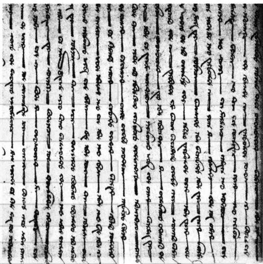
出土于吐鲁番阿斯塔那古墓地的粟特文买卖女奴文书

俗语,学者们推测可能是一批贵霜王国居民因战乱移民至此,他们人多,文化高,因而对当地的语文产生了重大影响。5世纪以后,佉卢文在西域消亡。