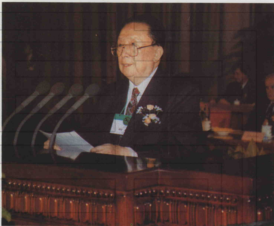
中华人民共和国人大常委会副委员长吴阶平 在第十届世界烟草或健康大会上致开幕词