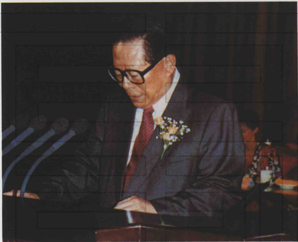
中华人民共和国主席江泽民 在第十届世界烟草或健康大会上讲话