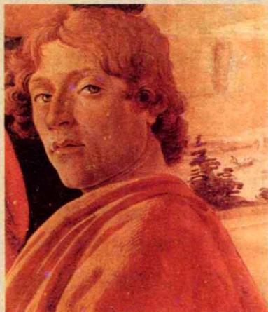
波提切利1479年作品《博士来拜》的局部,画中人物被认为是其自画像。