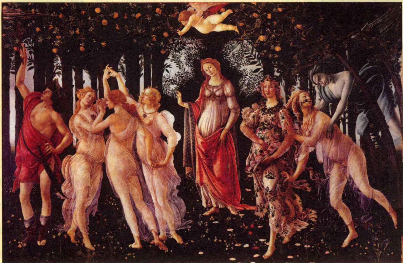
《春》(Primavera) 1482年作 [意大利]桑德罗·波提切利 蛋彩画 纵203厘米 横314厘米 藏意大利佛罗伦萨乌菲齐博物馆