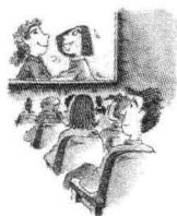
영화 보기 看电影