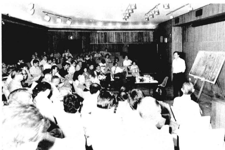
八五年作者在香港大會堂高座主講《大同哲學與易經》。