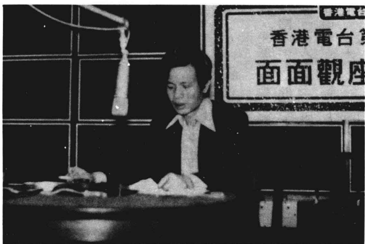
八〇年代作者在廣播電台主持節目時留影。