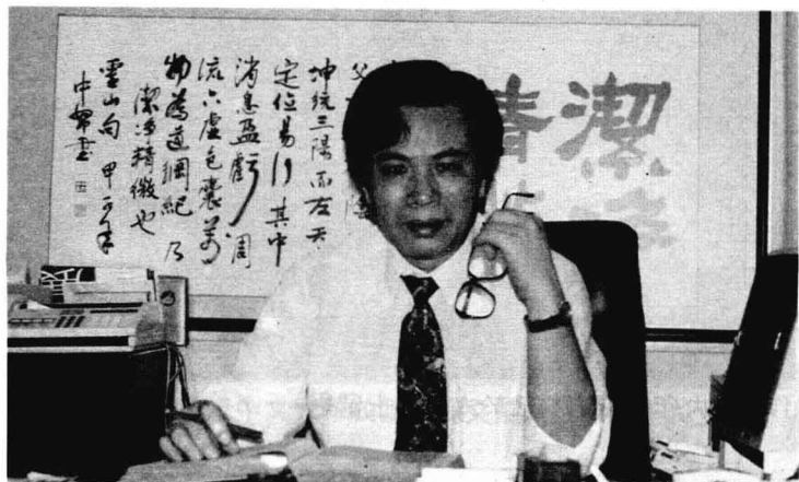
廿多年來窮經皓首，這是作者九三年十二月完稿時的近照。