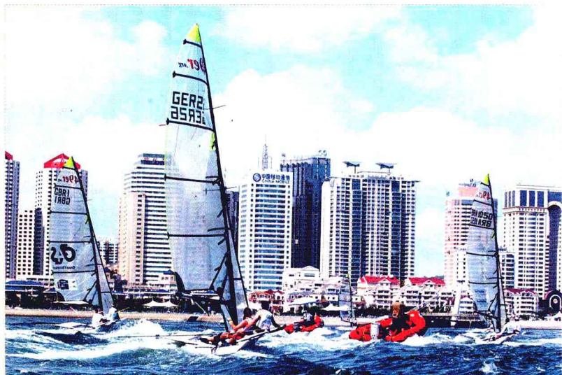
▲ 2007年6月4日,《中国应对气候变化国家方案》正式颁布实施,标志着中国对于全球气候与环境问题的重视和责任感,也是发展中国家在这一领域的第一部国家方案。图为海滨城市青岛。