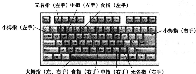
图 1-5 各手指的范围键

每个手指除了指定的基本键外,还分工负责其他键,称为它的范围键。各手指的范围键如图 1-5 所示。其中,2、W、S、X 和 9、O、L、. 键由无名指负责,3、E、D、C 和 8、I、K、, 键由中指负责,4、R、F、V、5、T、G、B 和 7、U、J、M、6、Y、H、N 键分别由左右手食指负责,1、Q、A、Z、0、P、;、/ 及有关键位由小拇指负责,空格键由大拇指负责。