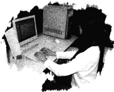
图 1-1 坐姿要求

③ 手指要求。键盘输入时的手指姿势如图 1-2 所示。用手击键时,要迅速、果断而富有弹性。