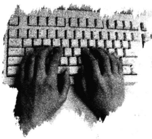
图 1-2 手指姿势