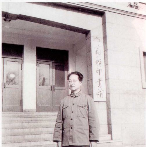
1979年 北京 王府井大街