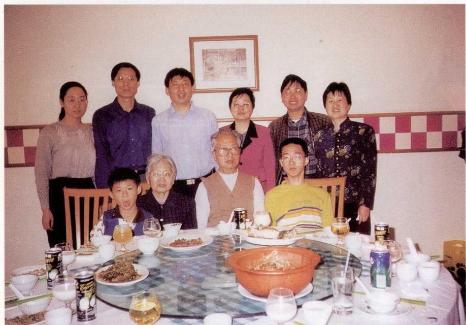
2000年春节 惠州 与部分家人合影