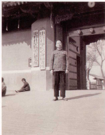
1966年 北京 端王府夹道