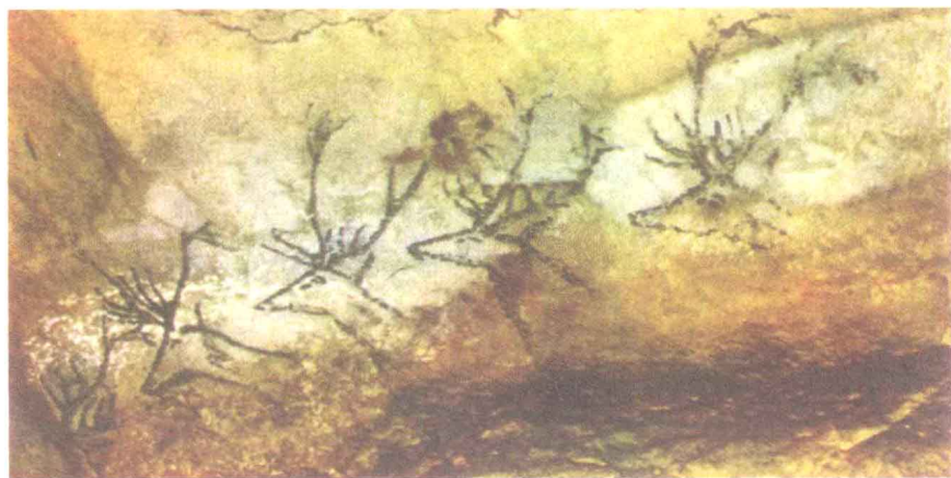
▲ 《渡河的鹿群》 法国罗尔狄洞