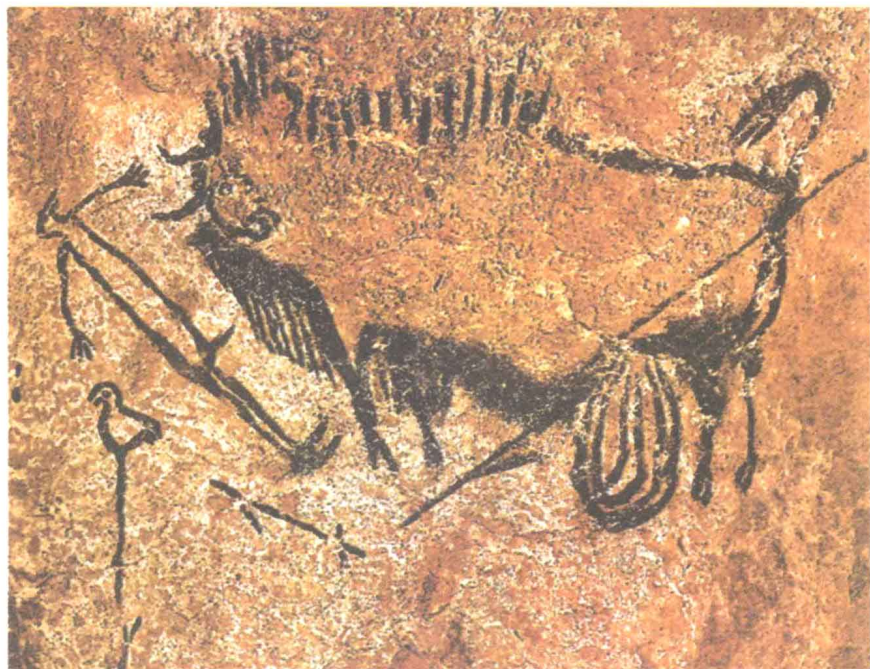
▲ 《受伤的野牛》 法国拉斯科岩洞壁画