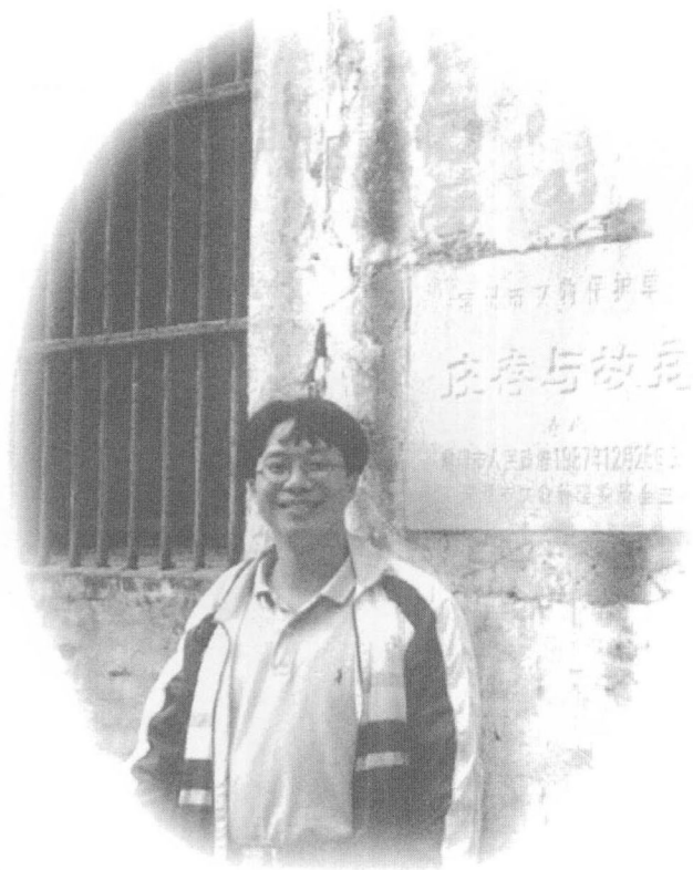
圖版一：本書作者於莊存與故居前留影。