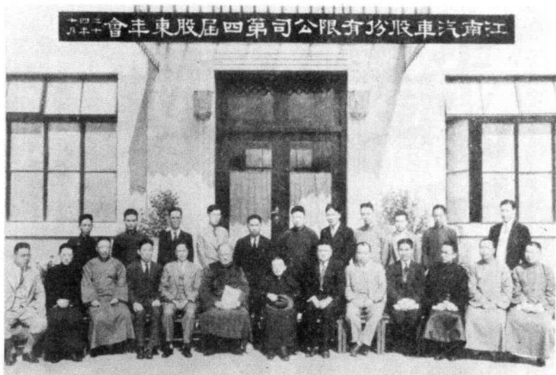
主持(者坐中)江靜長事董張月十年四十二國民 ○會年東股司公車汽南江