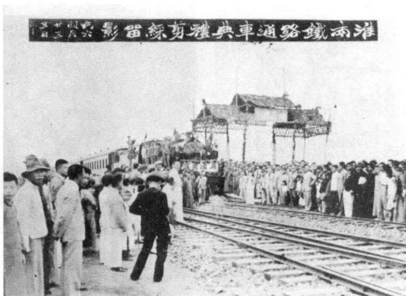
○影留綵剪禮典車通路鐵南淮月六年五十二國民