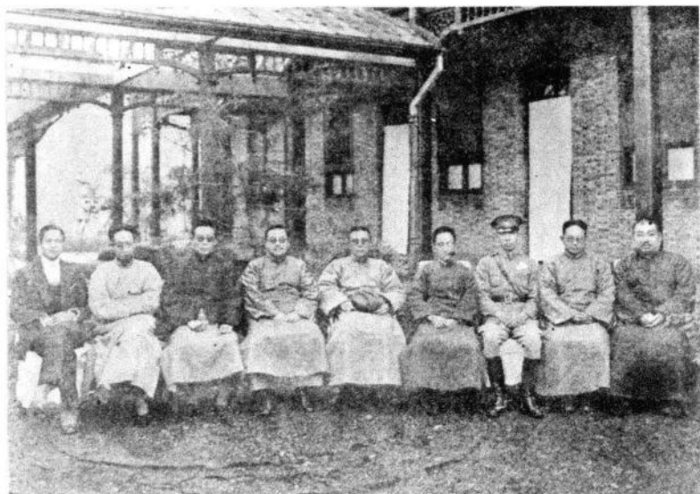
後職就雷布長廳陳廳育教省江浙月八年八十國民 。影合等（者坐中）江靜席主張與