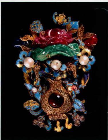
图八 银镀金嵌珠宝瓶花

答应交回”，这种做法从常理来看似乎违背常规，是什么样的制度要将用过的首饰送回呢？美国人罗友枝著《清代宫廷社会史》中曾引用宫内档案，得出没有子女的妃嫔死后的财产处置由皇帝掌管，一些归还到库房，一部分分发、赏赐给宫内其他妃嫔、宫女、太监，另有一部分作为随葬品。如果是这样的话，首饰有循环使用的情况，那么上面提及的黄条上应该就是记载的这种现象。