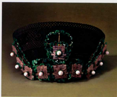
图六 镶珠翠青钿子

首饰中的黄条还有这样的记载，如：“银镀金盆花面簪一块，嵌饭块小正珠十颗，红宝石一块，假珠石，共重一两七钱，道光十一年十二月十四日收，睦答应交回”；“银镀金盆花面簪一块，嵌无光东珠一颗，假珠石，共重八钱，道光十一年十月十八日收，睦答应交回”。这里写明“睦