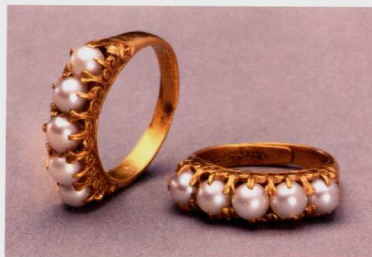
图一 金镶珍珠戒指

玉是软玉,硬度6.5,韧性超过硬玉,是一种含水的钙镁硅酸盐,半透明或不透明,多呈乳白色,是温润而有光泽的美石。玉器在古代社会既是精神财富,也是物质财富,同时也是政治和权力的化身。清代不仅以玉为礼器,同时