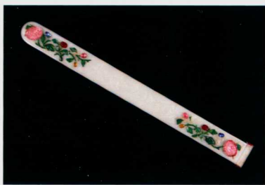
图四 白玉嵌珠宝翠花卉纹扁方