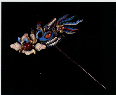
图七 银镀金嵌宝石串假珠凤纹簪