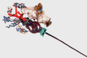
图二 银镀金镶珠娃娃瓶式簪