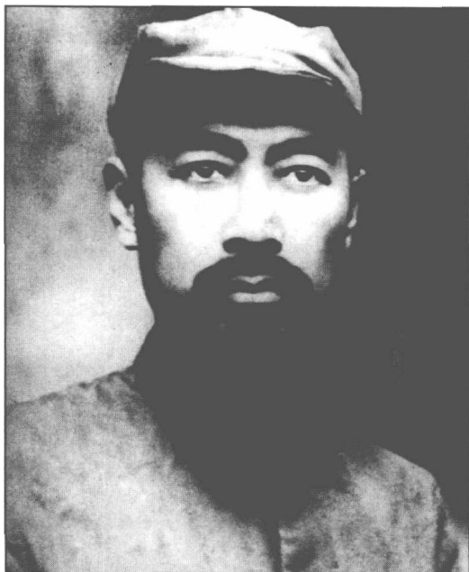
◎ 1931年12月到达中央革命根据地的周恩来。

在共产国际代表米夫的直接干预下，1931年1月7日，在上海召开的中共六届四中全会，以批判三中全会的所谓对于“立三路线”的“调和主义”为宗旨，强调要反对目前主要危险的“右倾”，决定“改造充实各级领导机关”。瞿秋白、周恩来等受到严厉指责。由于得到米夫的支持，在这次会议上，王明不仅被补选为中央委员，而且成为中央政治局委员。会议通过的决议中，正式将召开党的七大列为全党“最不可延迟的任务”之一，并“委托新的政治局开始必须的准备工作”。提出七大要总结苏维埃运动的经验，“要通过党的党纲和其他文件” ② 。这次会议实际上批准了王明“左”倾冒险主义的纲领，使以教条主义为特征的王明“左”倾错误在中央的统治达四年之久。