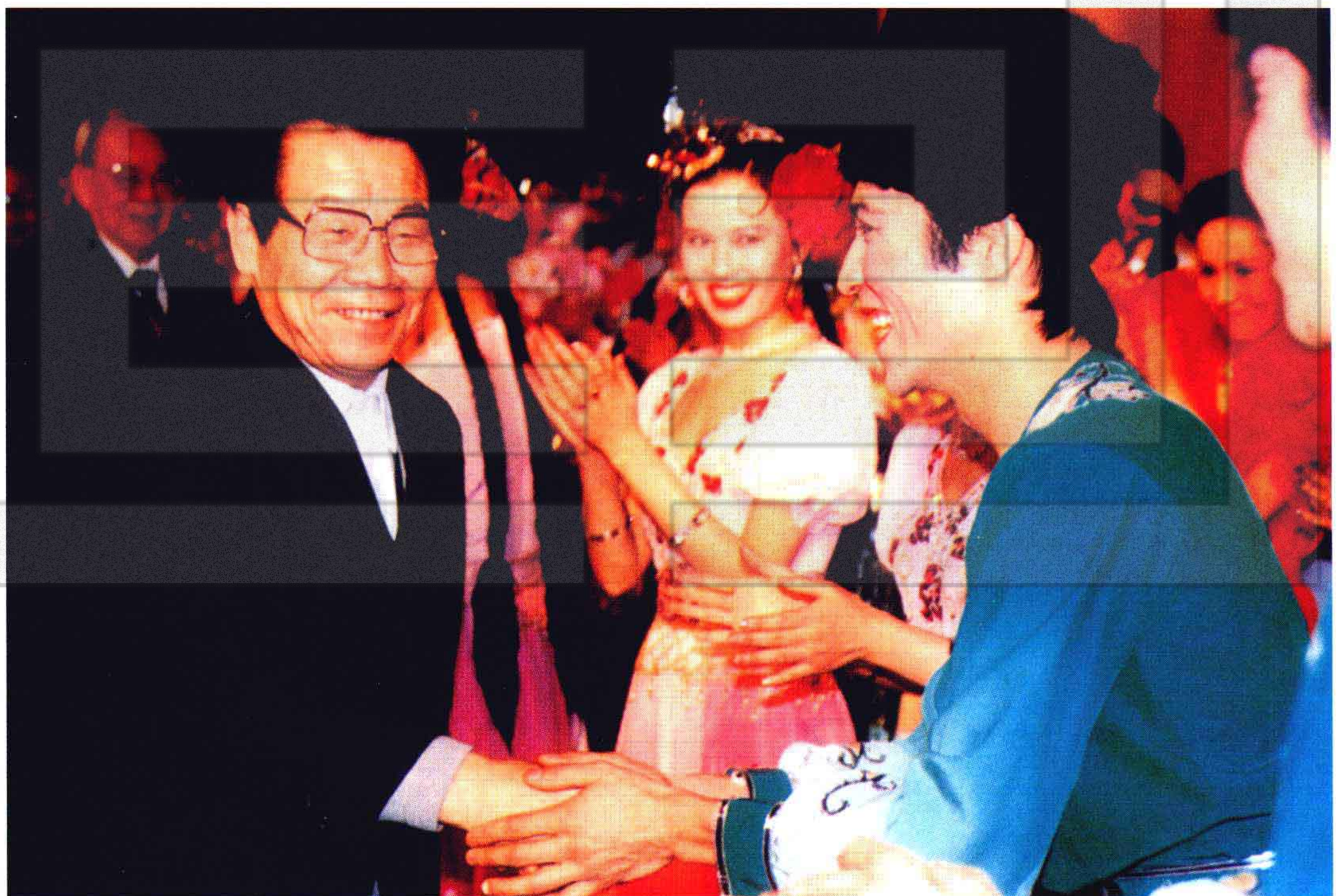
1989年12月，中央政治局常委、书记处书记李瑞环在北京中南海观看兵团歌舞剧团演出后接见演员