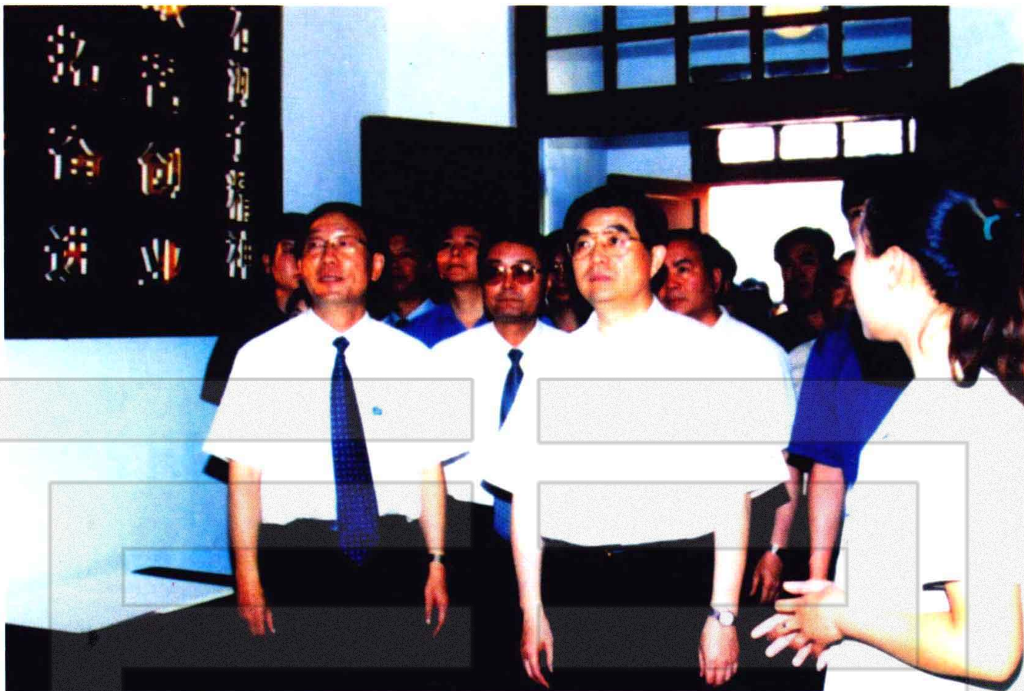
2001年6月13日，中央政治局常委、国家副主席胡锦涛（前中）参观石河子军垦博物馆