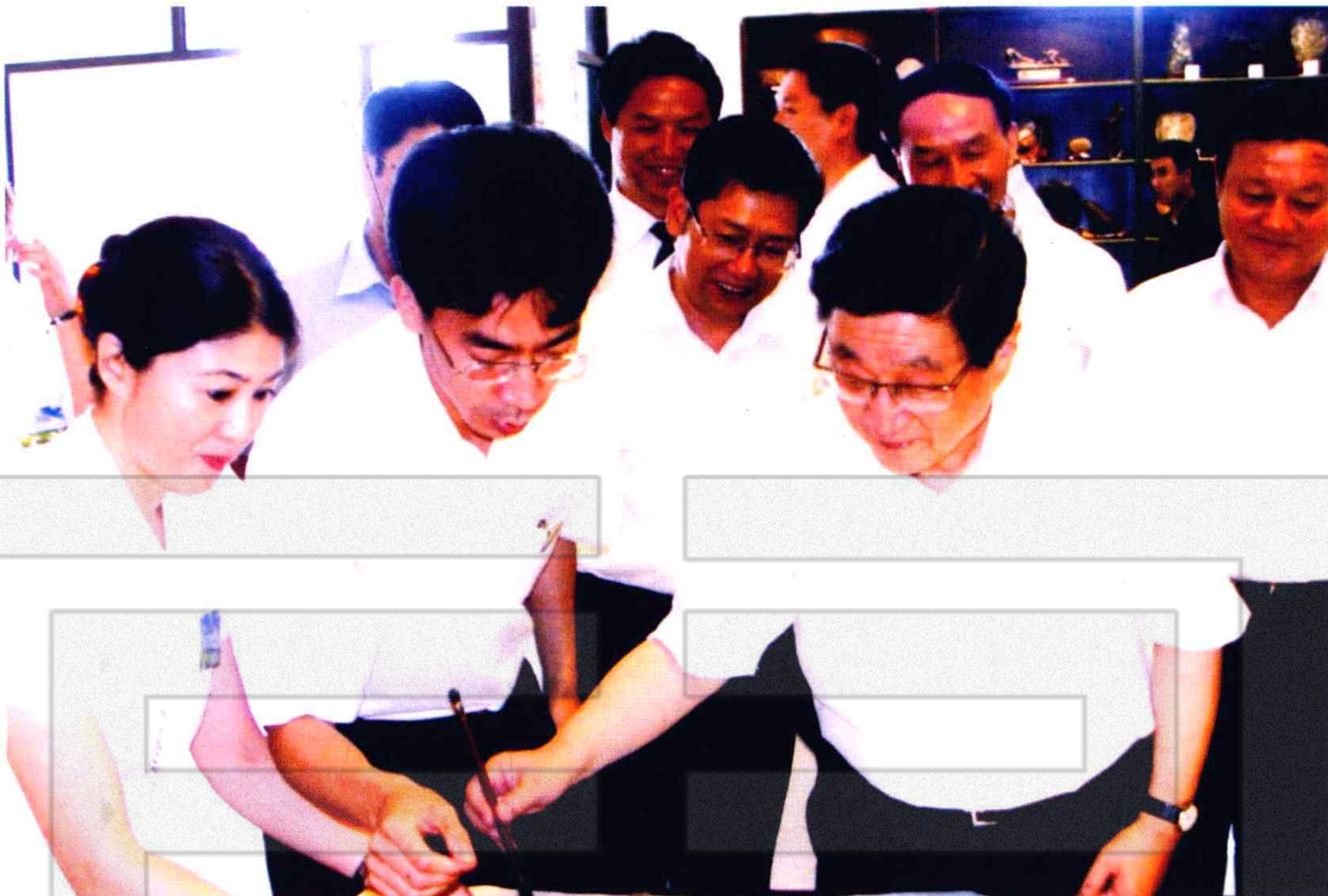
2005年7月28日，中央政治局常委、国务院副总理黄菊（前右一）在自治区、兵团领导陪同下参观兵团军垦博物馆后题词