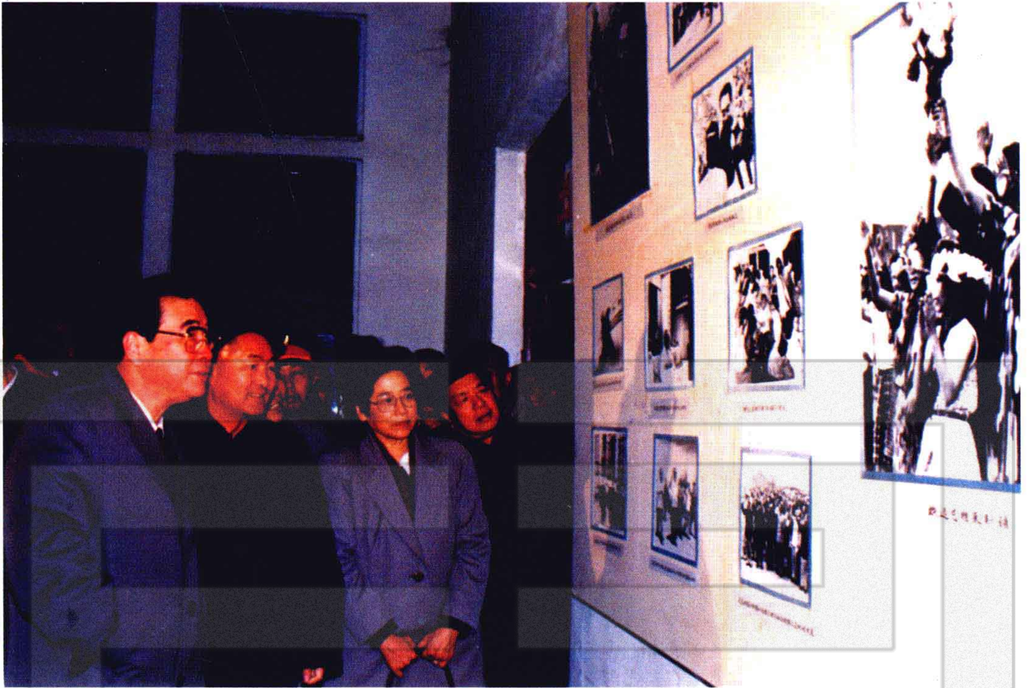
1989年11月23日，中央政治局常委、国务院总理李鹏（左一）在兵团领导陪同下，参观农八师石河子总场展览馆，观看1965年周恩来总理视察石河子总场时的图片