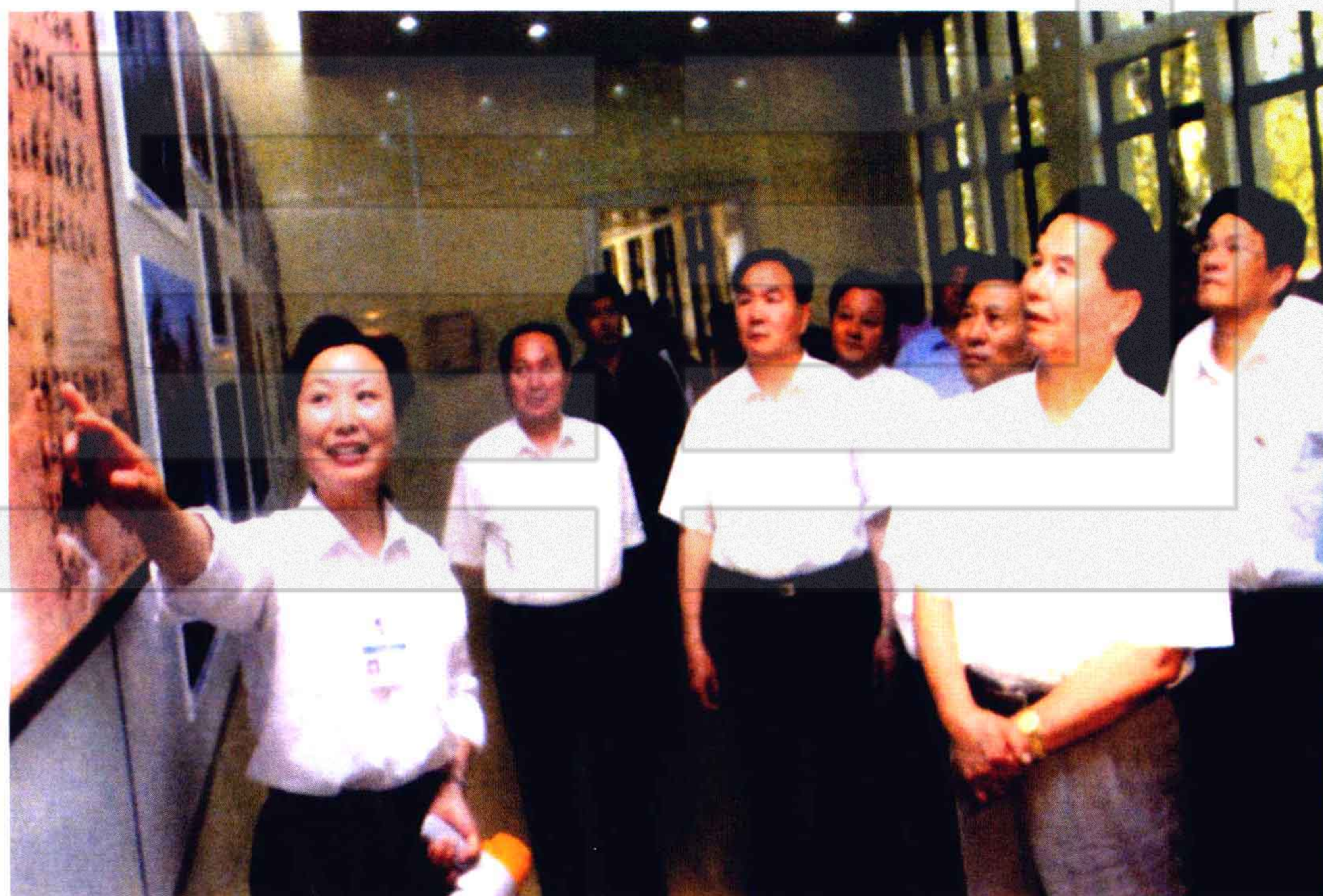
2004年6月13日，中央政治局常委、中纪委书记吴官正（前右一）在自治区、兵团领导陪同下参观石河子军垦博物馆