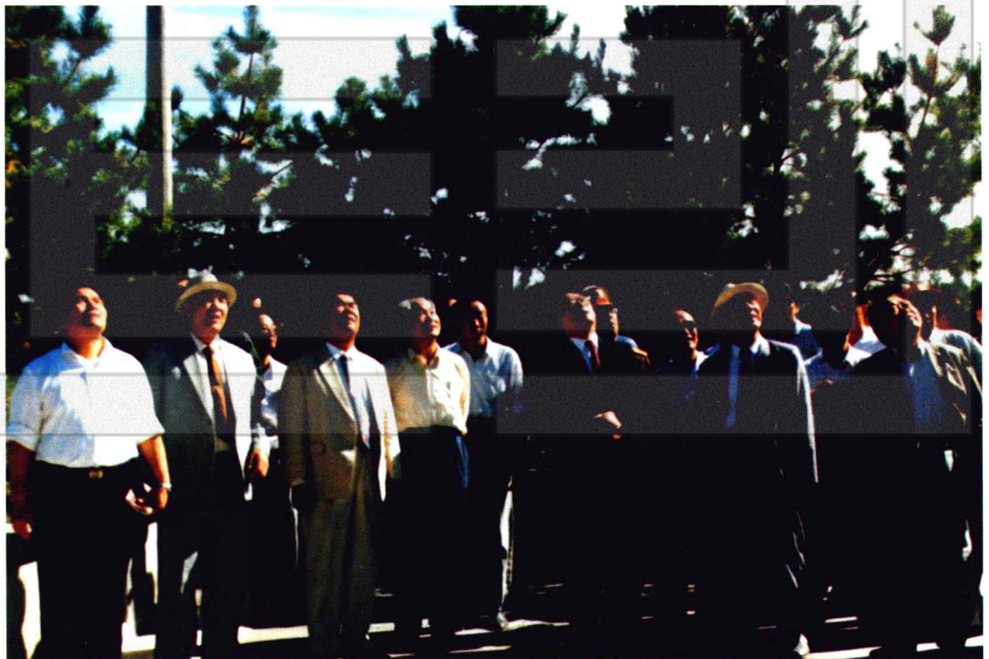
1990年8月28日，中共中央总书记江泽民（前右三）在全国政协副主席王恩茂（前右二）和自治区、兵团领导陪同下，瞻仰周恩来总理纪念碑