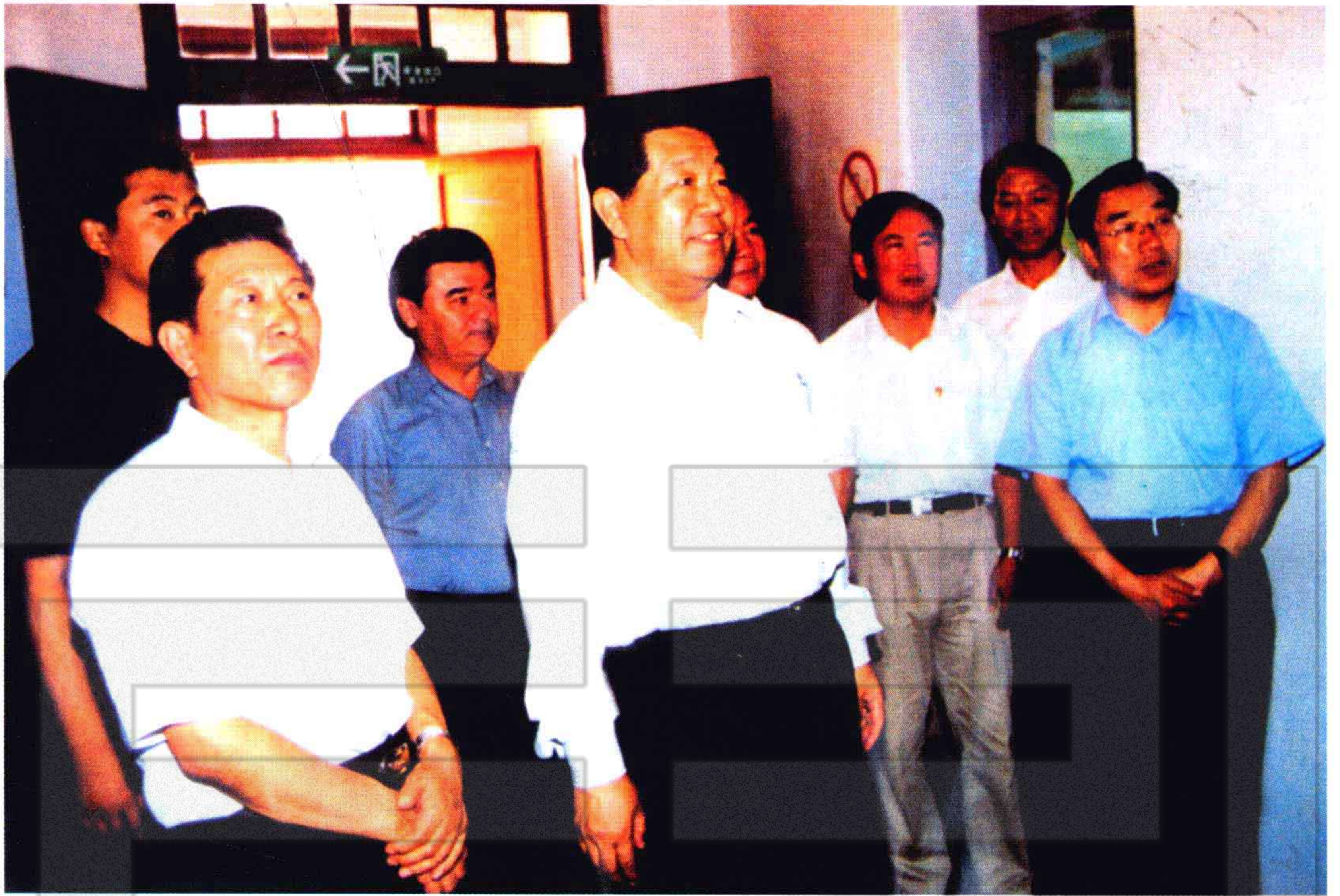
2003年9月8日，中央政治局常委、全国政协主席贾庆林（前中）在自治区、兵团领导陪同下瞻仰周恩来总理纪念馆