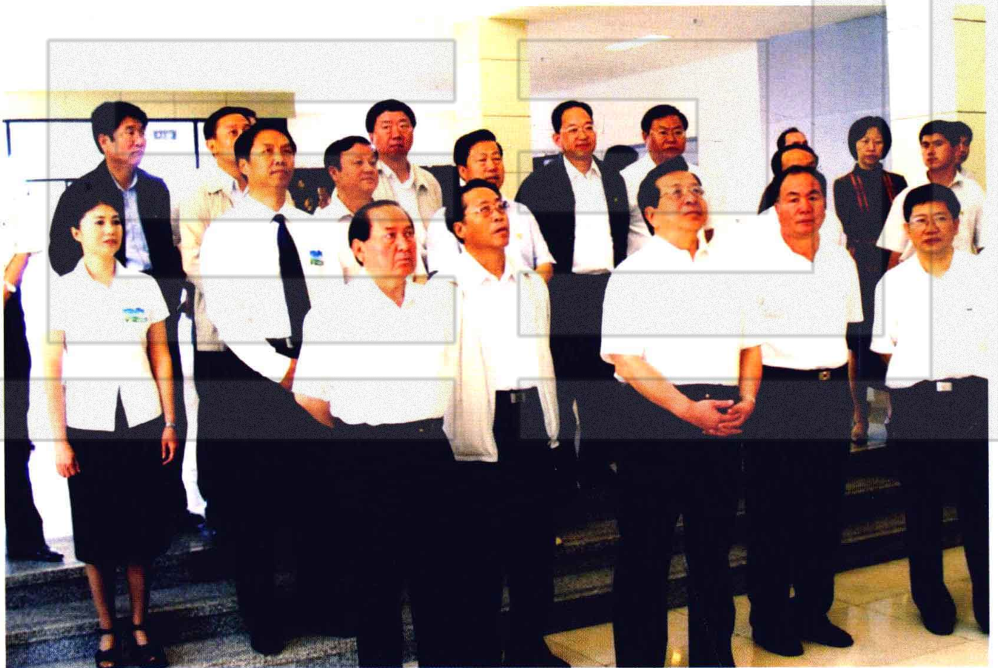
2005年8月23日，中央政治局常委、国家副主席曾庆红（前中）在自治区、兵团领导陪同下，观看兵团军垦博物馆前厅挂图