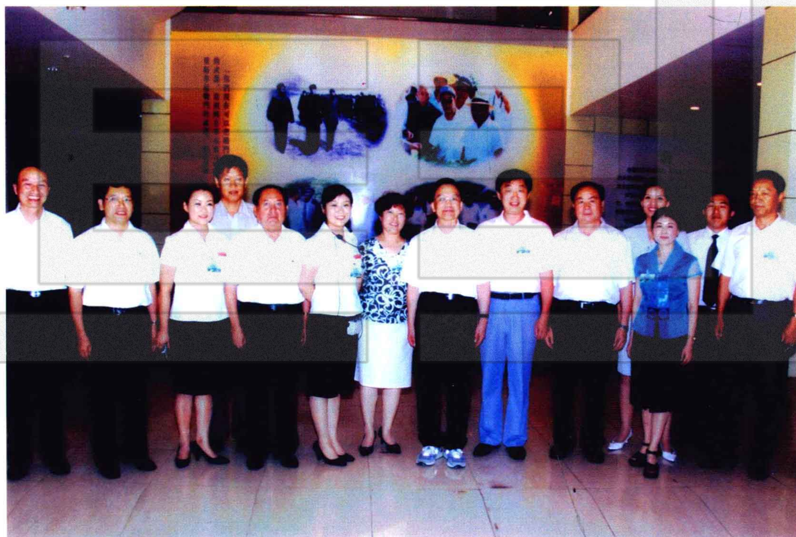
2007年8月8日，中央政治局常委、国务院总理温家宝（前右五）参观兵团军垦博物馆后，与自治区、兵团领导及博物馆工作人员合影