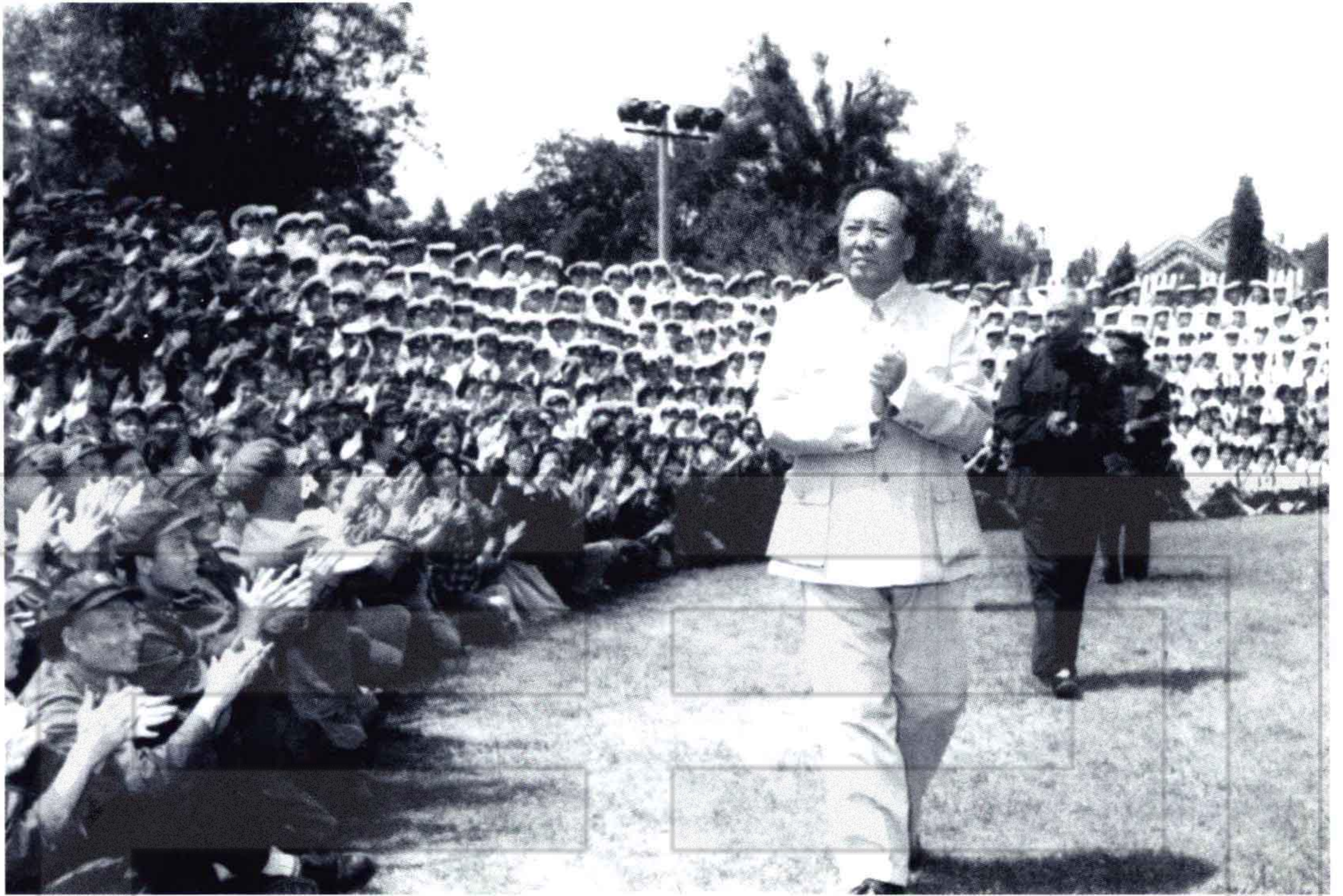
1959年8月，兵团组队赴京参加全军第二届文艺汇演，毛泽东、刘少奇等党和国家领导人接见全体演职员