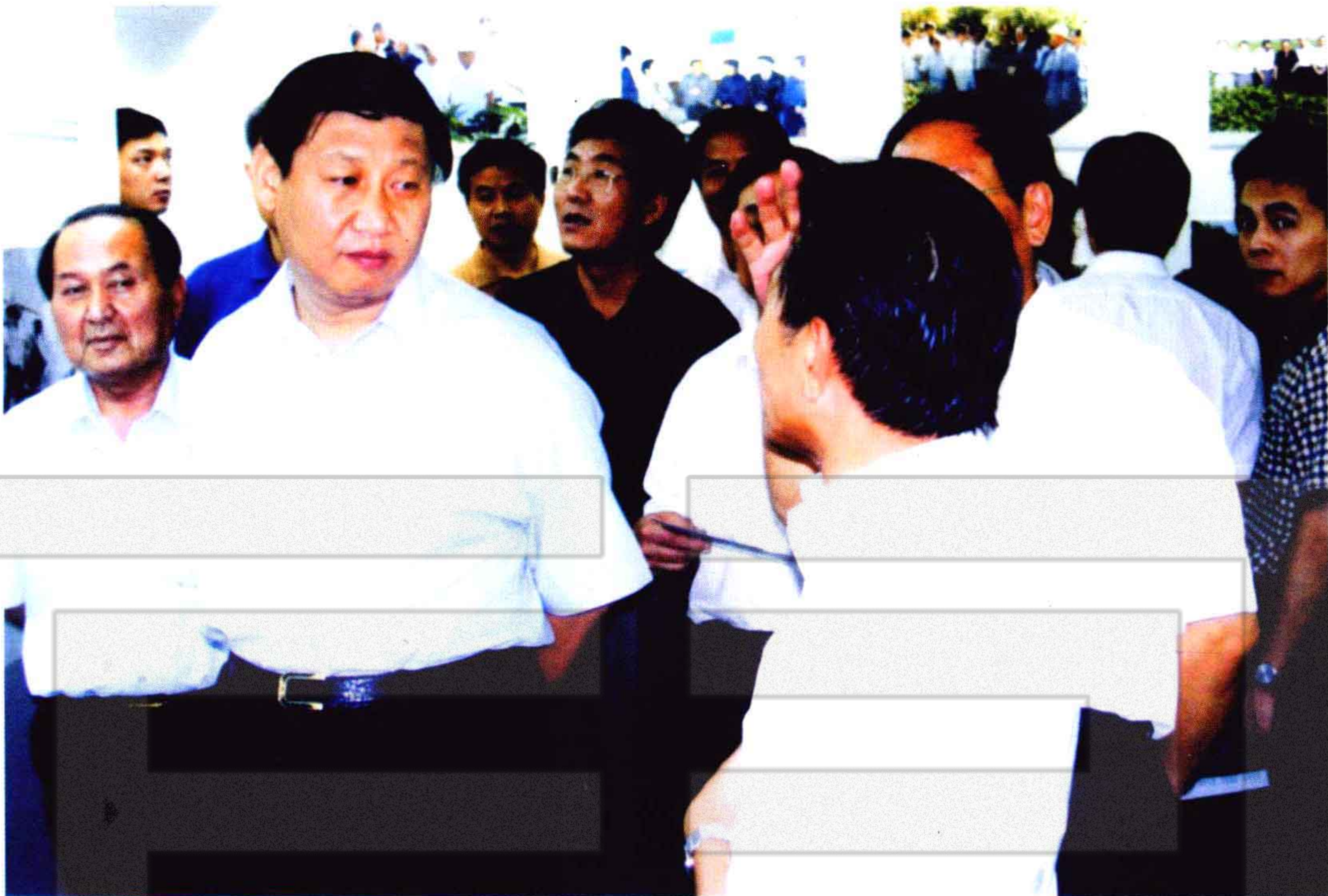
2003年8月20日，浙江省省长习近平（左二）在自治区、兵团领导陪同下参观石河子军垦博物馆