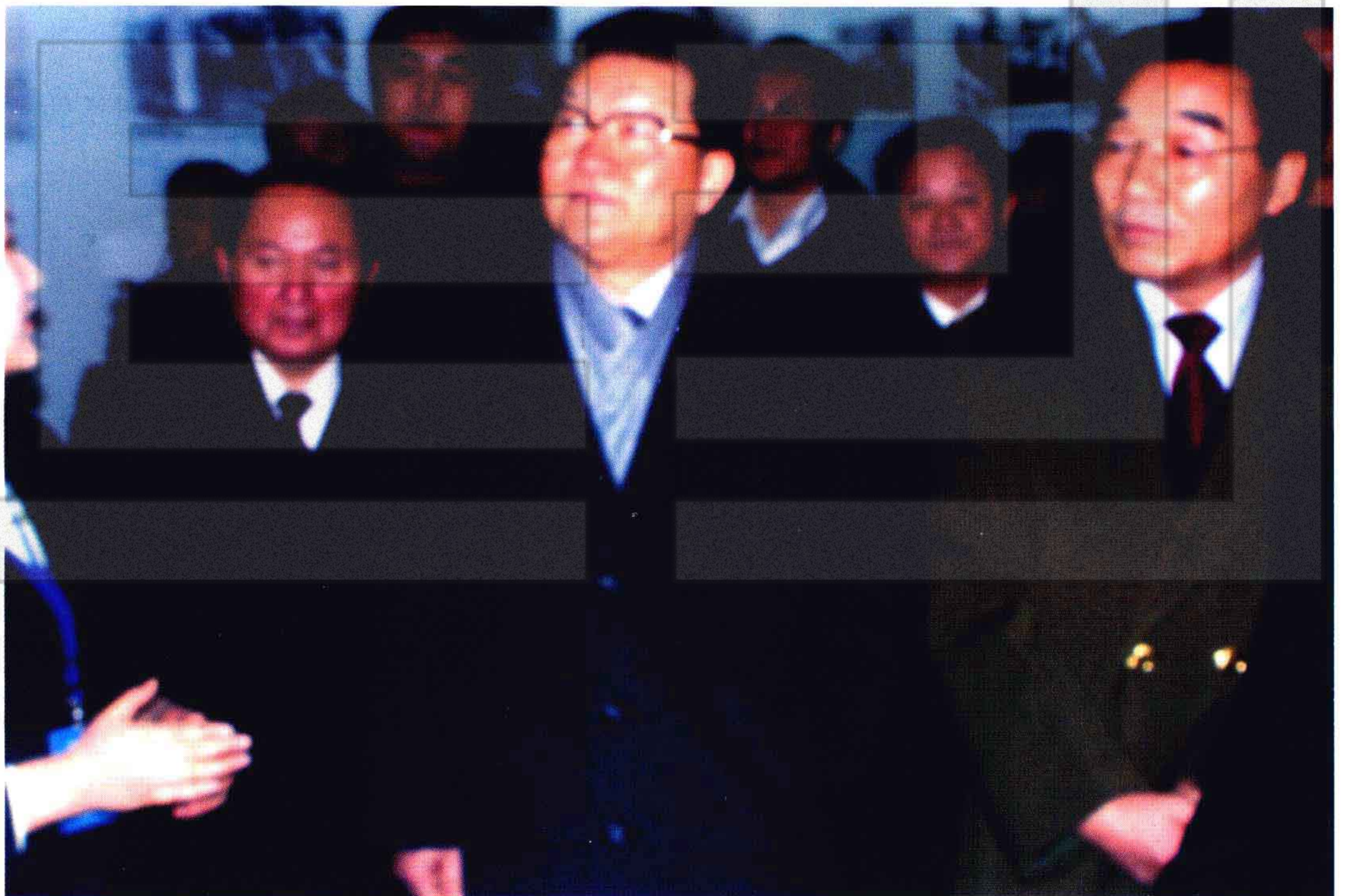
2004年1月8日，中央政治局常委李长春（前中）在自治区、兵团领导陪同下参观石河子军垦博物馆