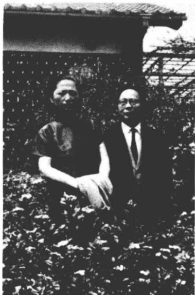
●一九六八年九月攝於私立東海大學宿舍前院。