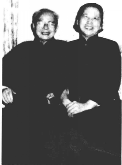
●一九八一年三月十日離港赴美前攝於九龍寓所。