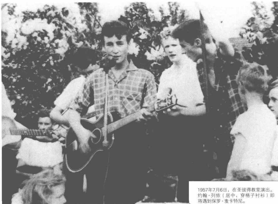
1957年7月6日，在圣彼得教堂演出。 约翰·列侬（居中，穿格子衬衫）即 将遇到保罗·麦卡特尼。