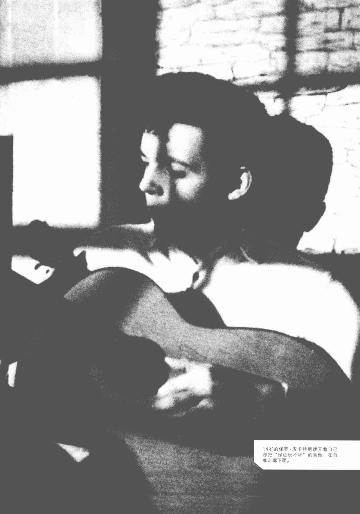
14岁的保罗·麦卡特尼拨弄着自己那把“保证玩不坏”的吉他，在自家走廊下面。