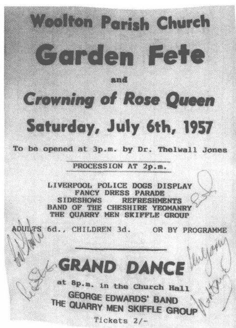
沃尔顿教区晚会通告：“采石工”是作为一支噪音乐队被介绍给公众的。

翰（Jean-Sans-Terre）的宪章向缔造利物浦的先民作出让步的750周年纪念仪式上，“采石工”表演的音乐会第一次有了照片记录。