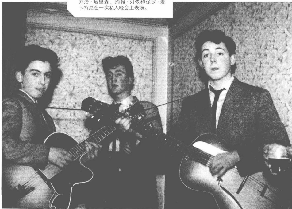
乔治·哈里森、约翰·列侬和保罗·麦卡特尼在一次私人晚上表演。