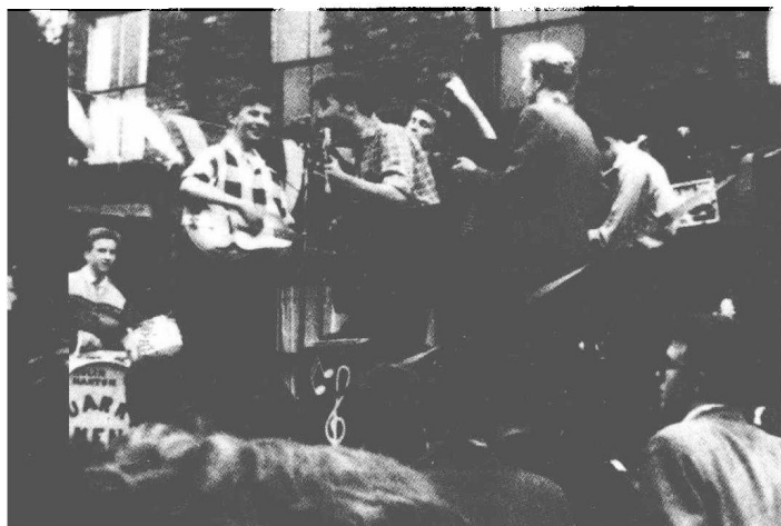
1957年6月22日，罗斯伯里街。“采石工”在一辆运煤车的翻斗上表演。我们能在大鼓上看到乐队最初的名字“Quarry Men”。

音乐生涯的起步时间定为1957年6月9日。他认为，乐队的五名成员（经过许多波折后，乐队成员固定为五个人，包括“绝对领导”约翰·列侬、头儿最亲密的伙伴皮特·肖敦、比尔·史密斯、伊万·沃恩和奈杰尔·沃利）1956年即有过几次演出经历，但都没有留下痕迹。可以肯定的是，1957年3月到4月间，他们在利物浦的以下场所进行了表演：格拉夫顿舞厅（Grafton Ballroom）、洛迦诺舞厅（Locarno Ballroom）、帕维诺剧院（Pavilion Theatre）和里亚尔托舞厅（Rialto Ballroom）。1957年3月，约翰·列侬和皮特·肖敦二人组以“黑杰克”（The Black Jacks）为乐队名，在利物浦某地演出过。