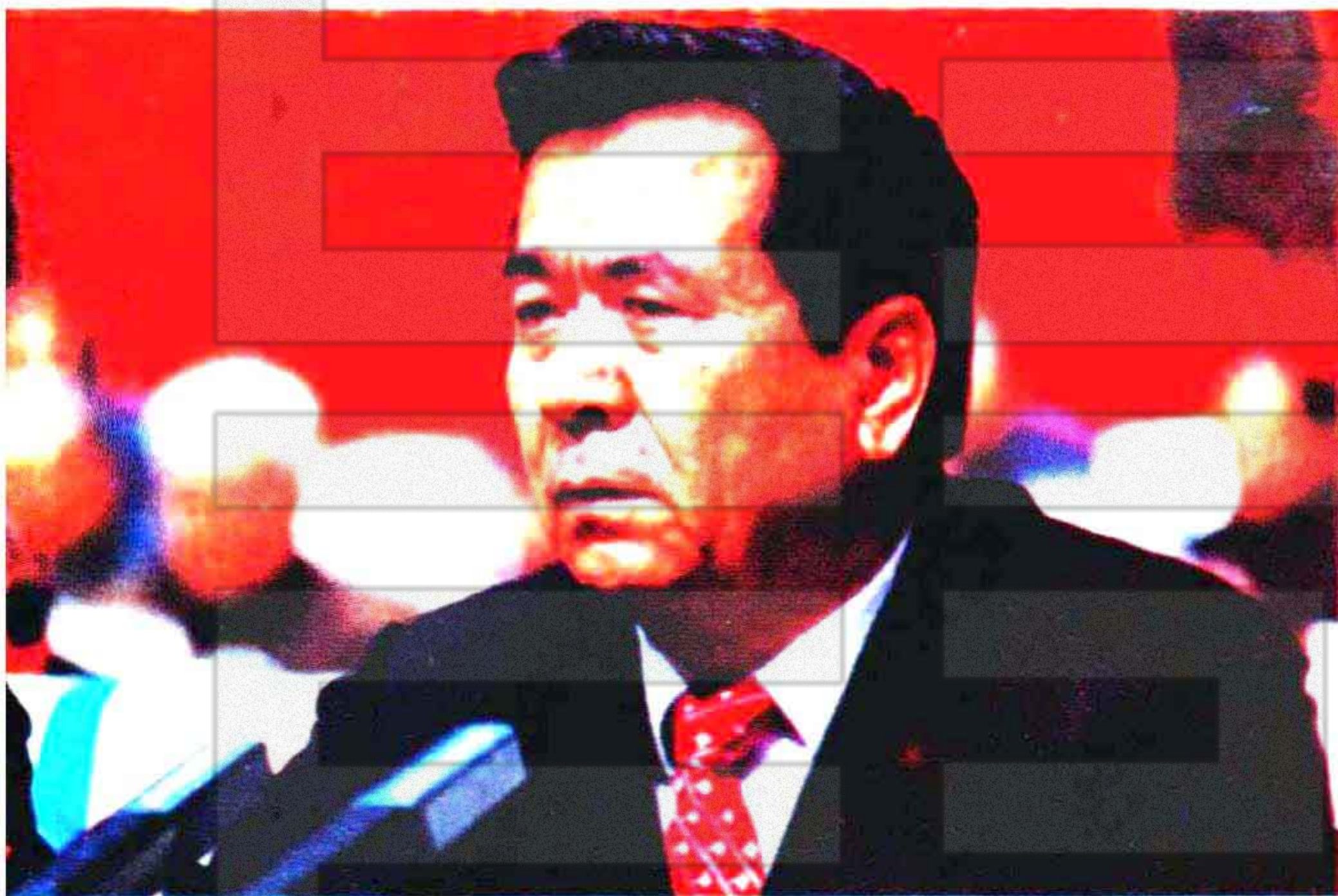
自治区人民政府主席铁木尔·达瓦买提同志 致开幕词