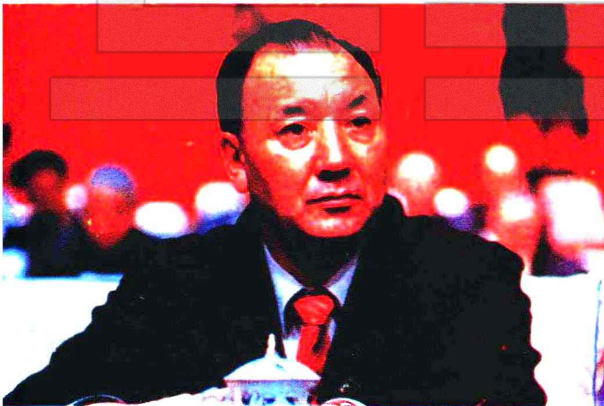
自治区党委 副书记贾那布尔 同志致闭幕词