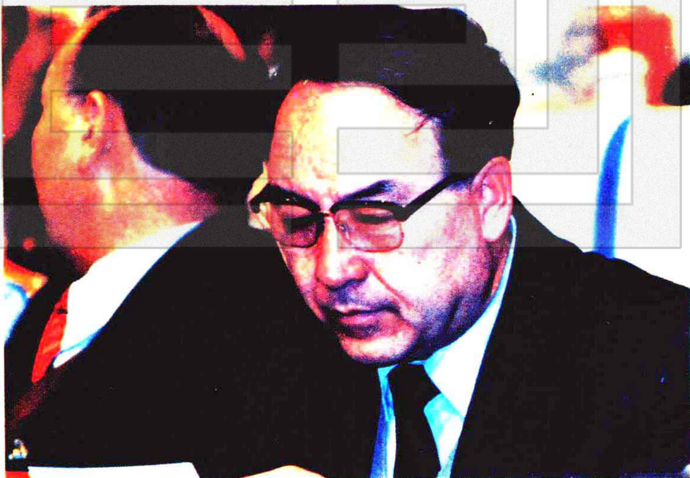
国务院民族事务委员会主任司马义·艾买提同志在大会上讲话。