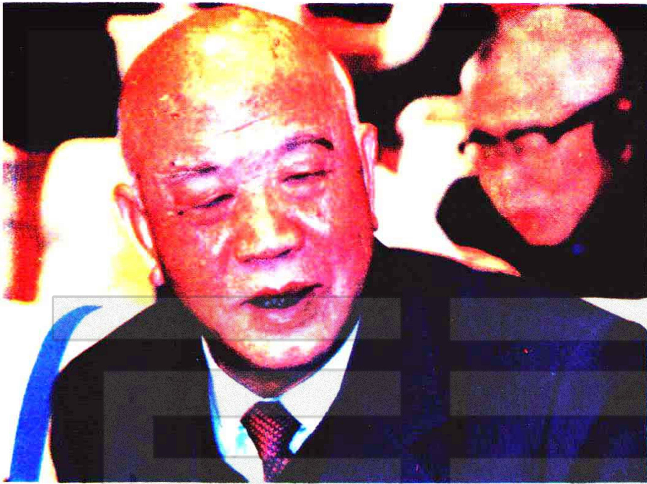
全国政协副主席、自治区顾问委员会主任王恩茂同志在大会上作重要讲话。