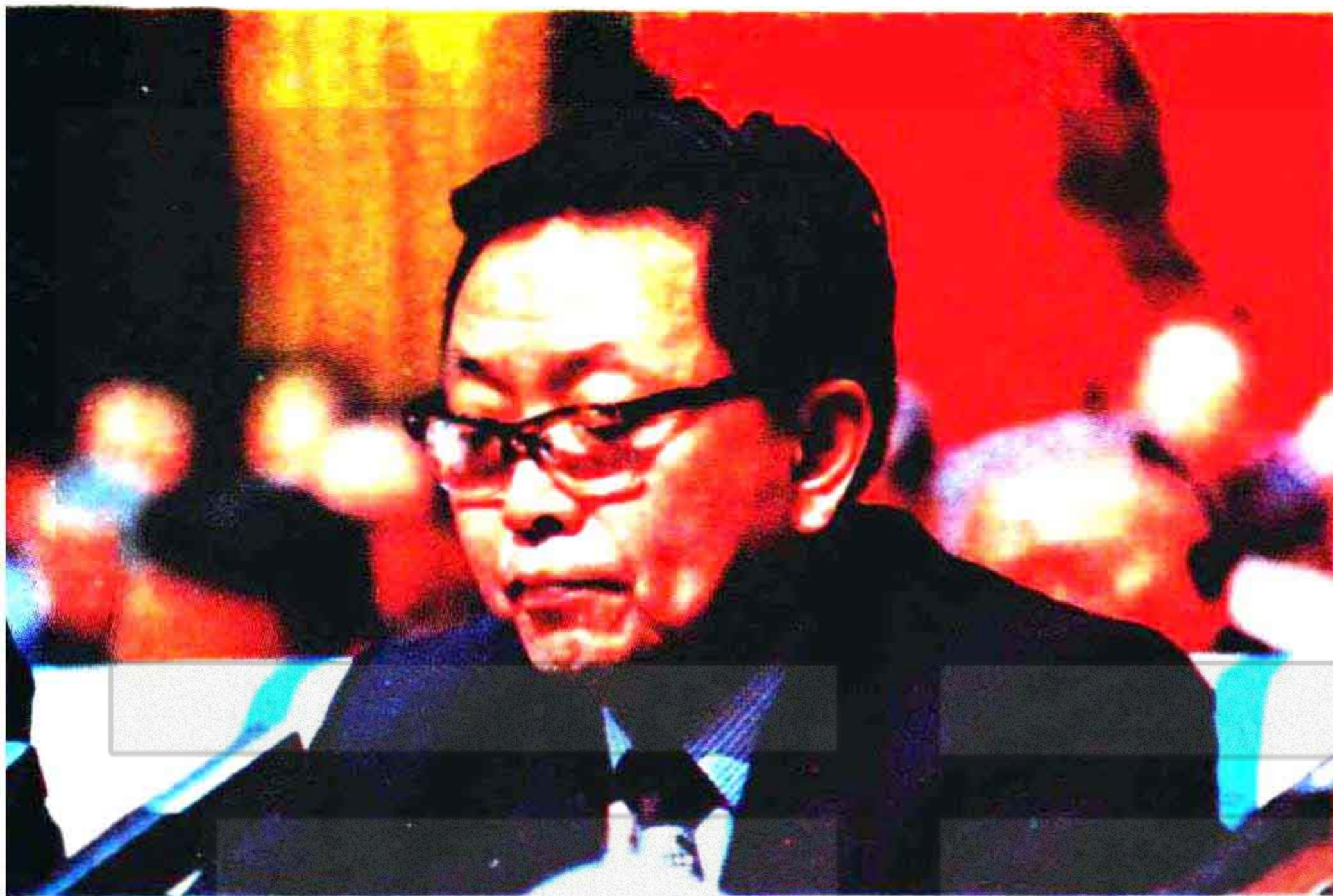
自治区党委书记宋汉良同志 在大会上作报告