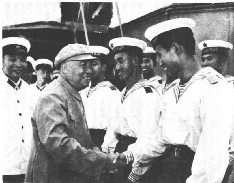
一九七四年八月，朱德委员长视察人民解放军海军某部时，和战士亲切握手。