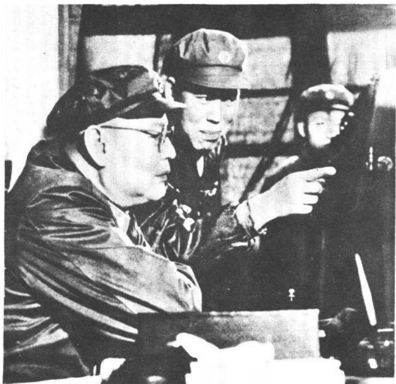
一九六一年六月，叶剑英副主席视察航空兵某部时，观察飞机射击练习器。