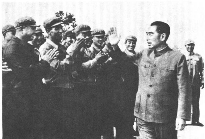
一九六五年，周恩来总理接见中国人民 解放军空军某部有功人员。