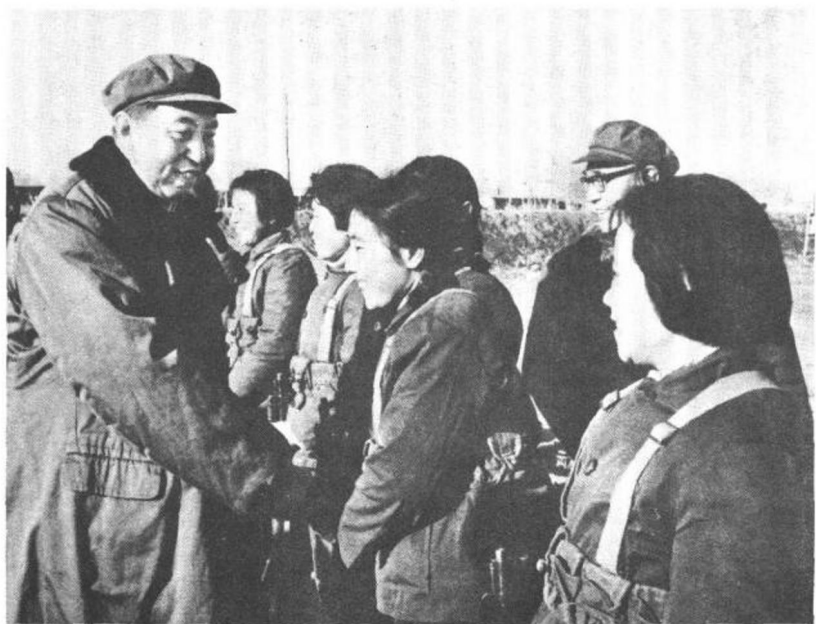
一九七七年四月十八日，华主席视察大庆工农村先锋五队时，同女民兵亲切握手。