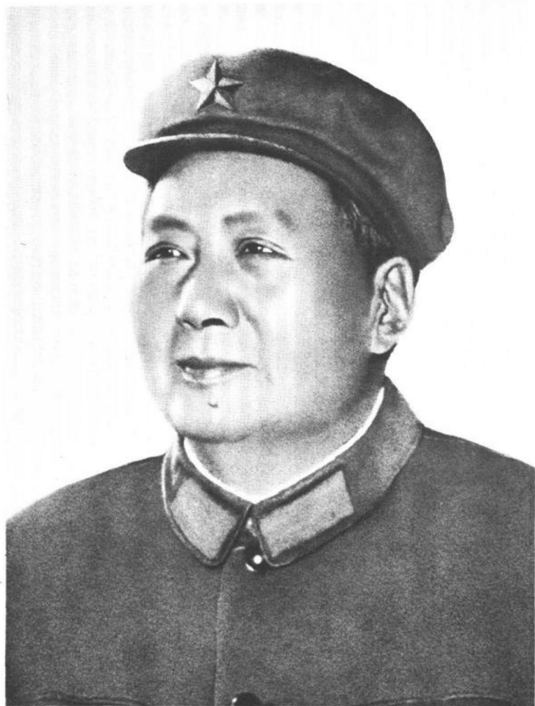
伟大的领袖和导师毛主席