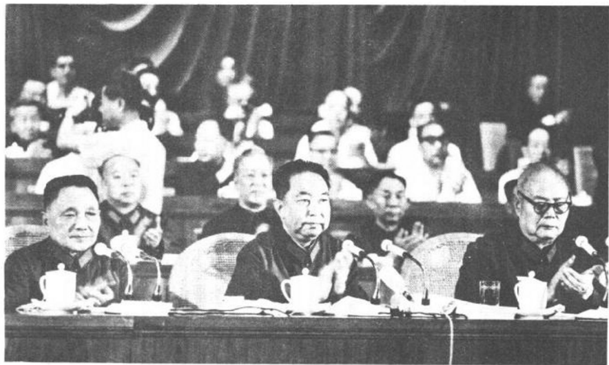
华国锋主席，叶剑英、邓小平副主席在 中国人民解放军建军五十周年庆祝大会主席 台上。