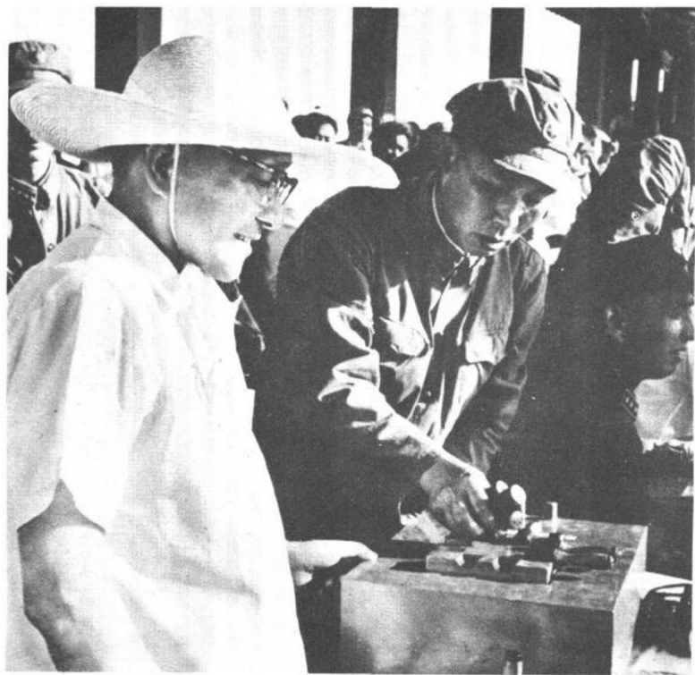
一九六四年六月，邓小平副主席观看人民解放军某部军事表演。