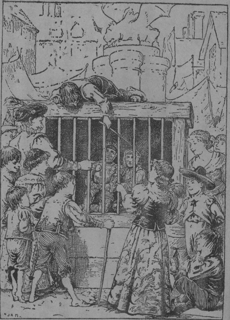
許多無禮的兒童圍繞着他們