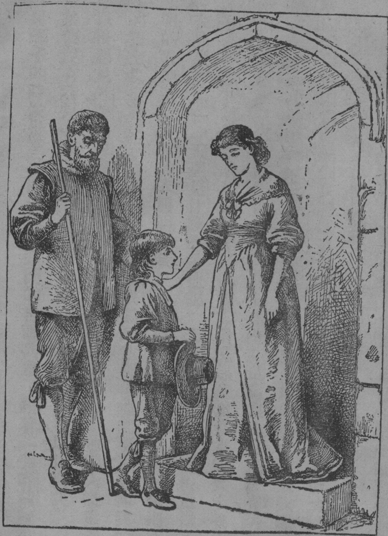
上 肩 的 他 在 手 按 輕 輕 她