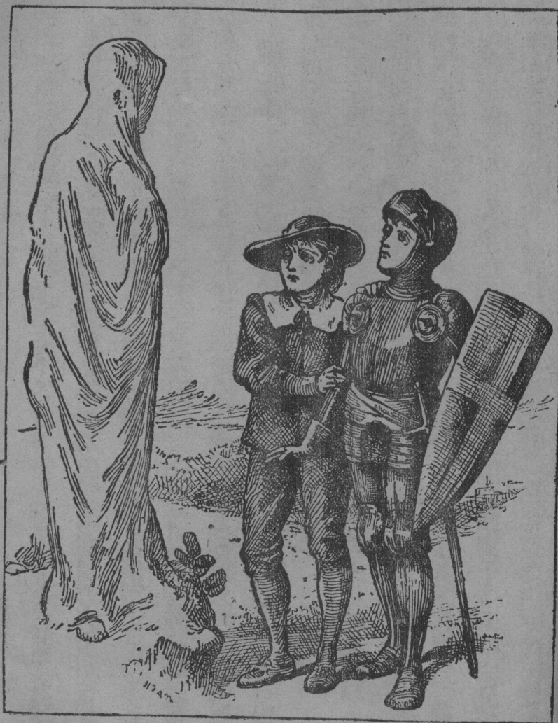
妻 的 得 羅 起 想