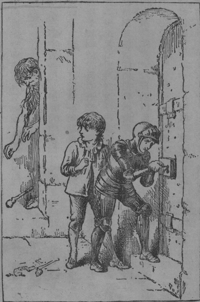
大漢的棒忽然落在地上