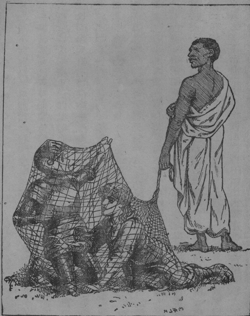
他 們 竭 力 掙 扎