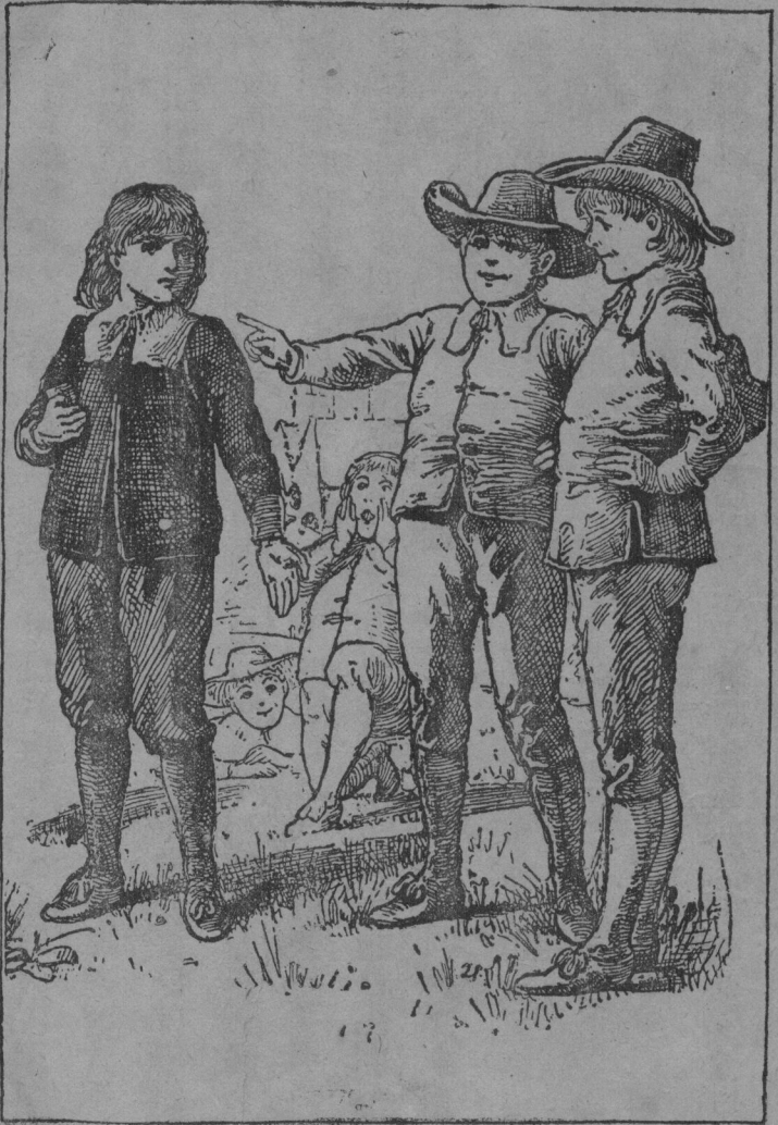
他 笑 譏 發 愈 們 他