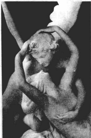
（图：神话——古希腊悲剧之源）

就以世界十大古典悲剧中的几部作品为例，在古希腊神话故事中，伟大的普罗米修斯因为违抗神王宙斯的意志，盗取神火赐予在黑暗中受难的人类，而被宙斯钉在高加索风雨侵蚀的峭壁上经受几千年的磨难和酷刑。借用天神们围绕着神权你争我夺的故事，塑造了一个普罗米修斯不肯屈服于神权这样的形象，为了拯救人类，他忍受着痛苦折磨，人们被他的意志力所震撼。这是埃斯库罗斯笔下的人物。