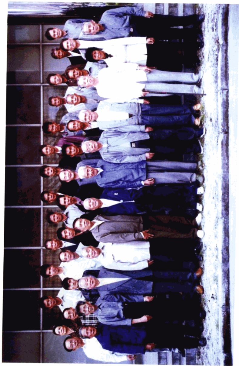
龙湾地区革命斗争史编写领导小组扩大会议留影