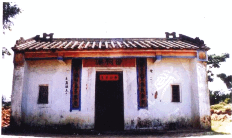
农民抗日武装中队成立誓师大会旧址