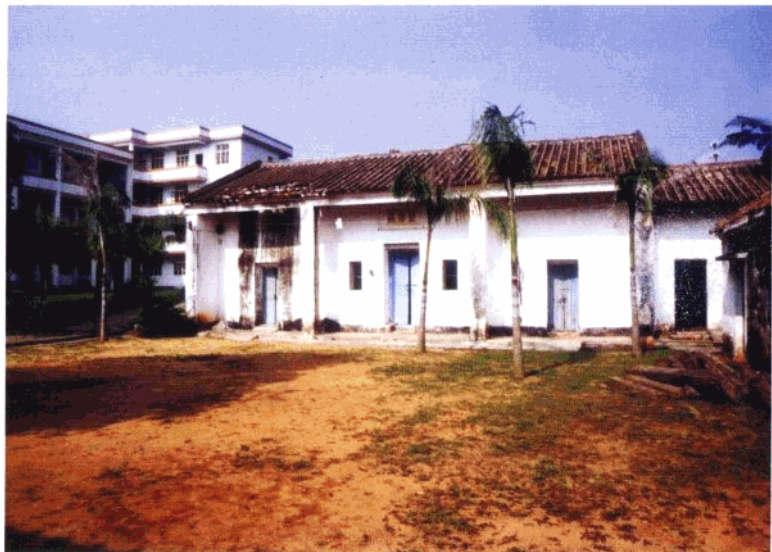
龙舍联村党支部成立原地——英才小学旧校舍